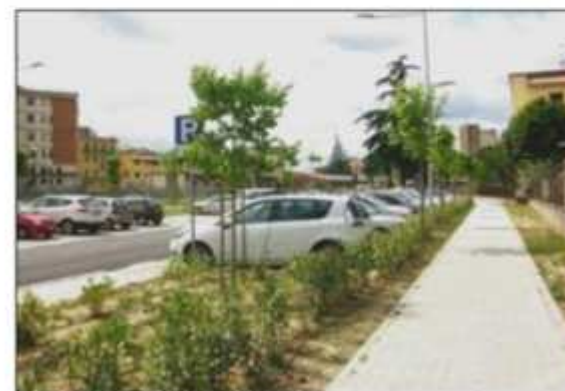
FOTO 4: La sistemazione verde del parcheggio