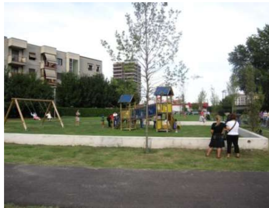
Realizzazione del parco di via Grandi