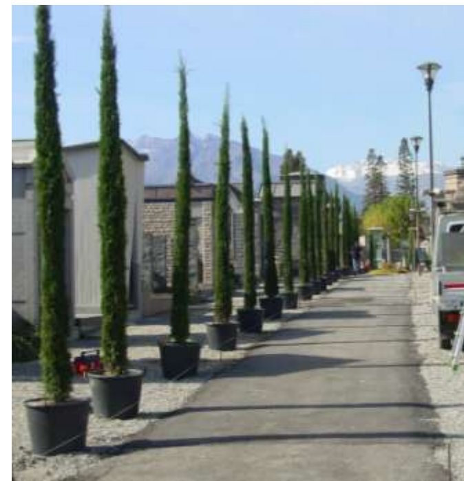
Messa a dimora di nuove piante in diverse aree della città