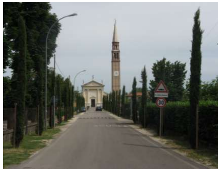
Riqualificazione di un viale alberato