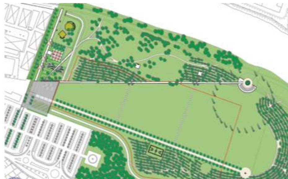
Progetto "Parco dell'Isolabella"