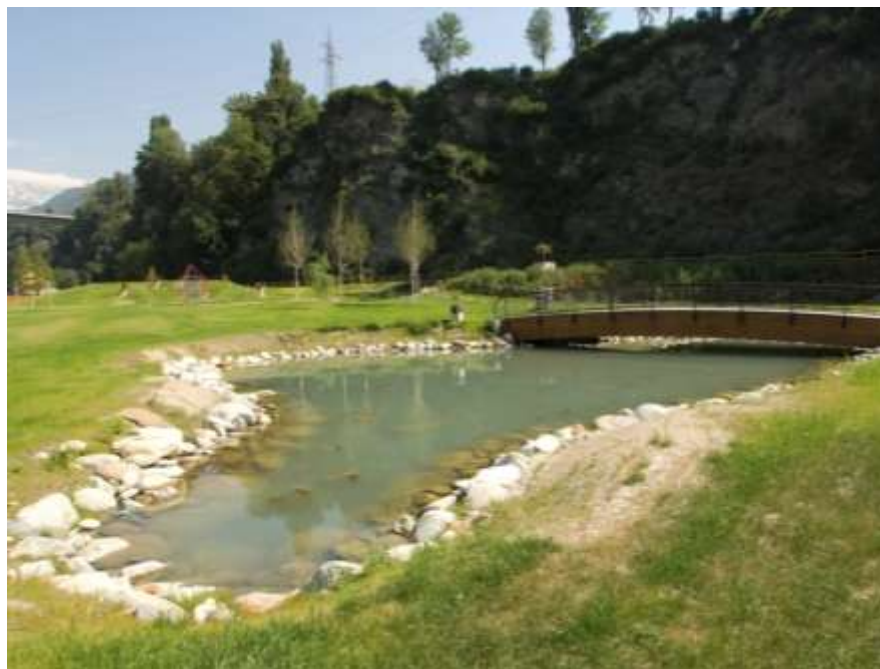
Realizzazione del parco Saumont