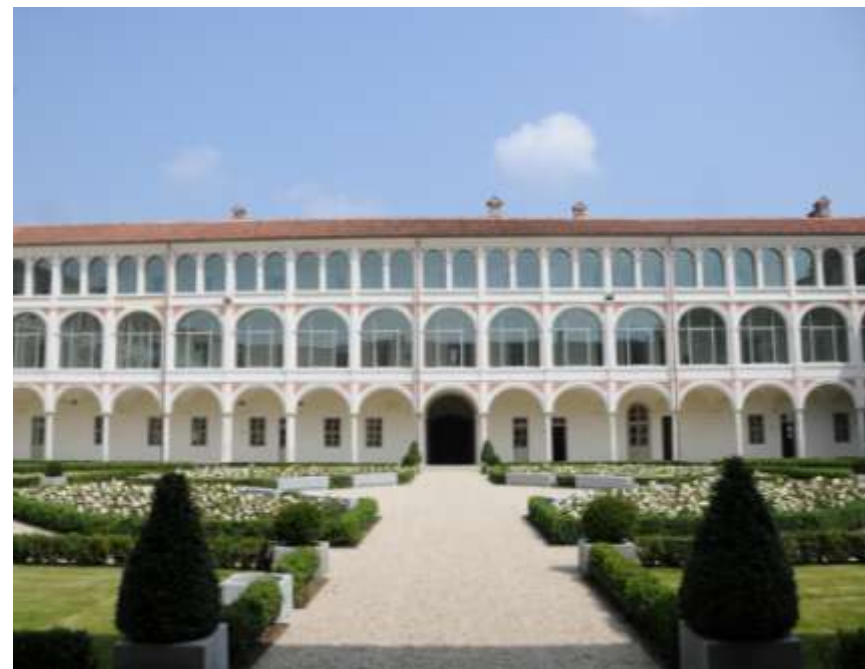
Recupero e rifunzionalizzazione del complesso dell'ex Convento di Santa Monica