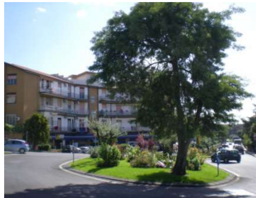
Riqualificazione di aree urbane con inserimento di rotatorie stradali