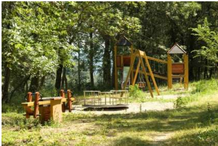
Riqualificazione della riserva naturale Chatelier