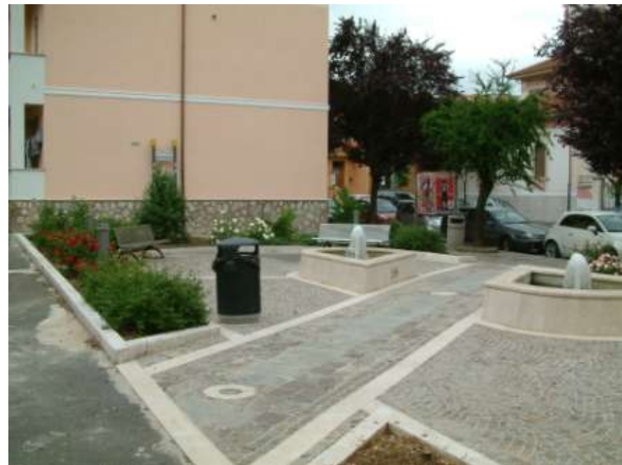
Largo Merolli prima e dopo l'intervento di riqualificazione