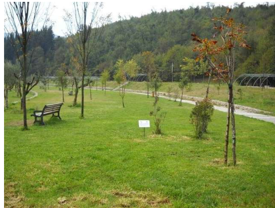
Messa a dimora di nuovi alberi