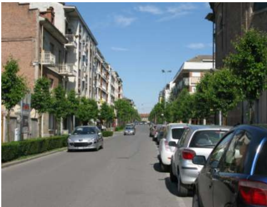
Sostituzione di alberate urbane