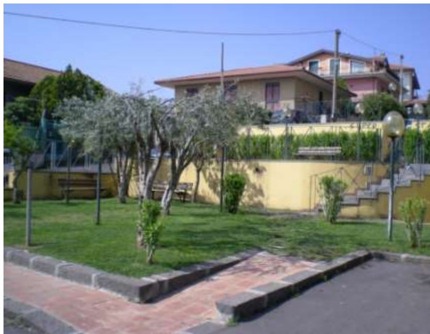
Realizzazione del parco urbano Trinità