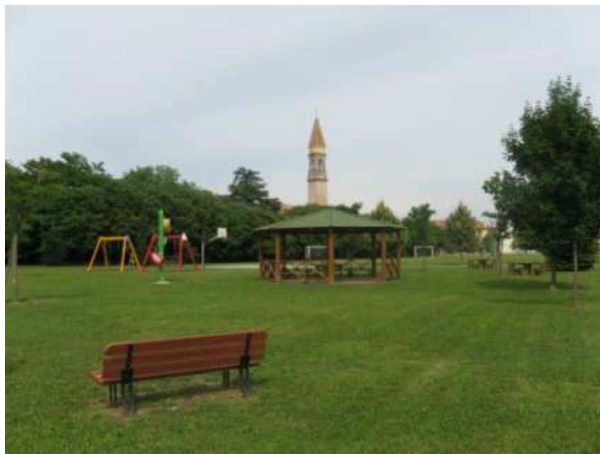
Riqualificazione dell'area verde di via del Domenicale