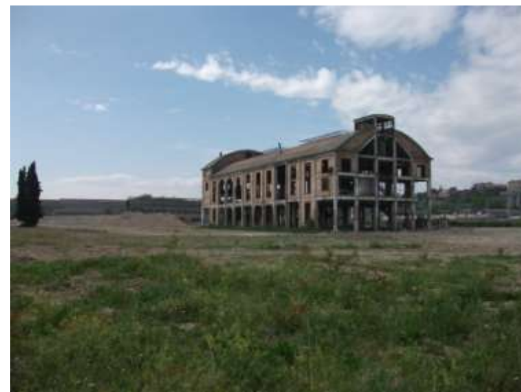
Progetto di riqualificazione dell'area ex Saddam