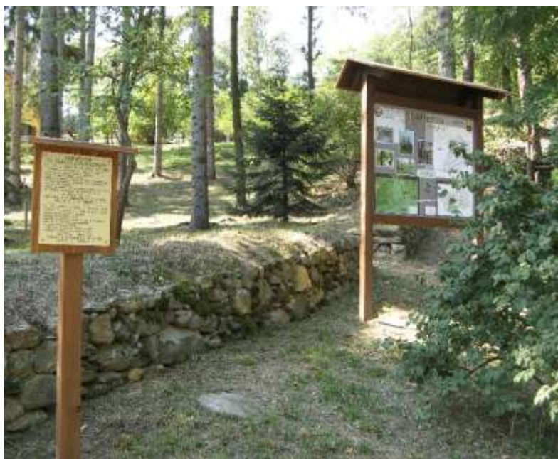
Riqualificazione dell'arboreto di Entrebain