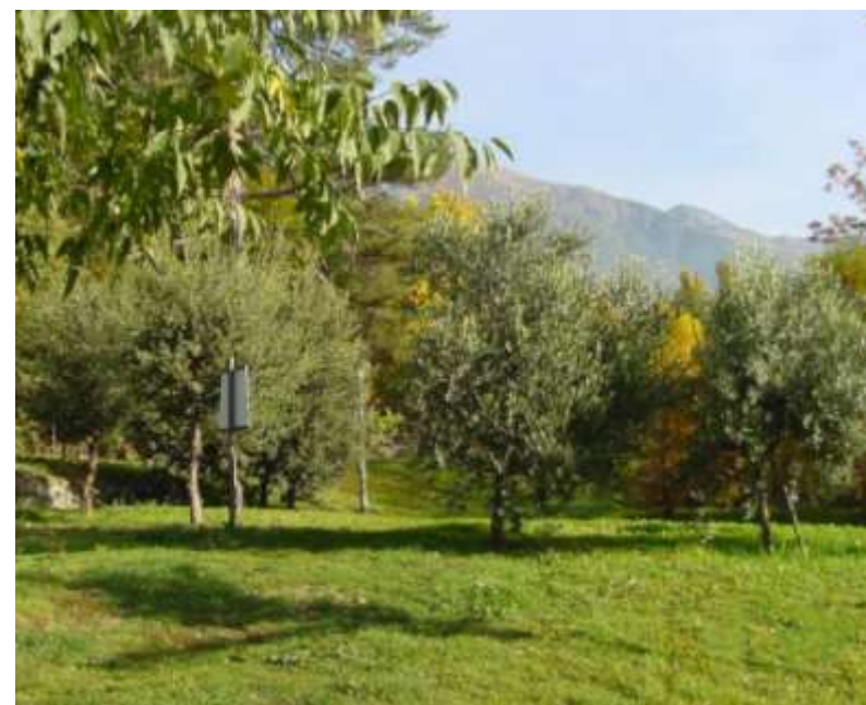
Realizzazione del parco didattico Fontaine Saint Ours