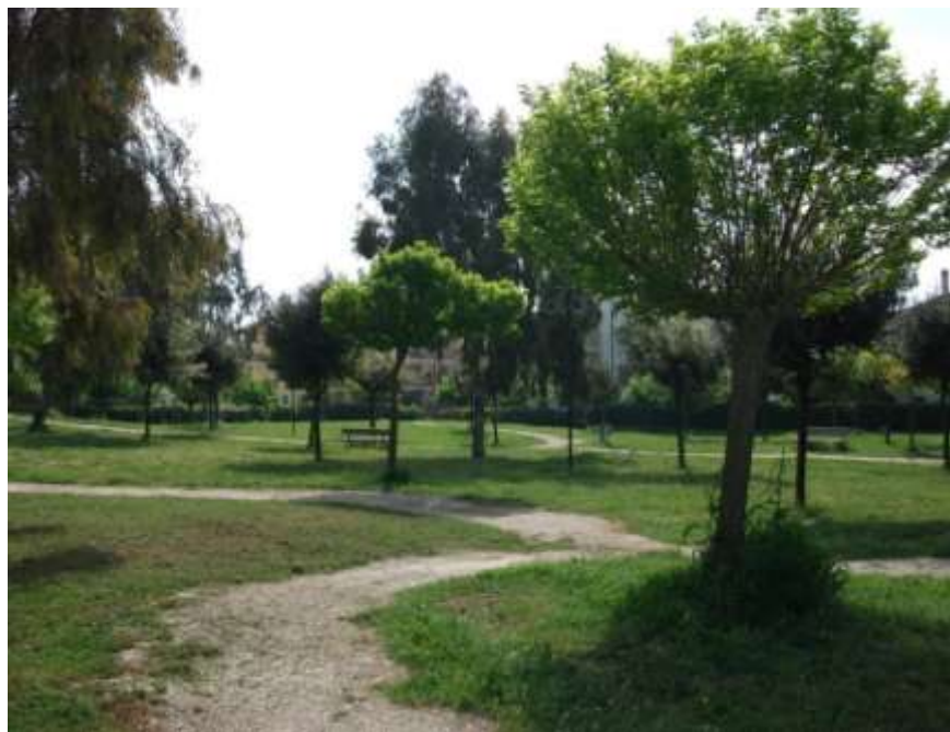
Realizzazione del parco di via del Campetto