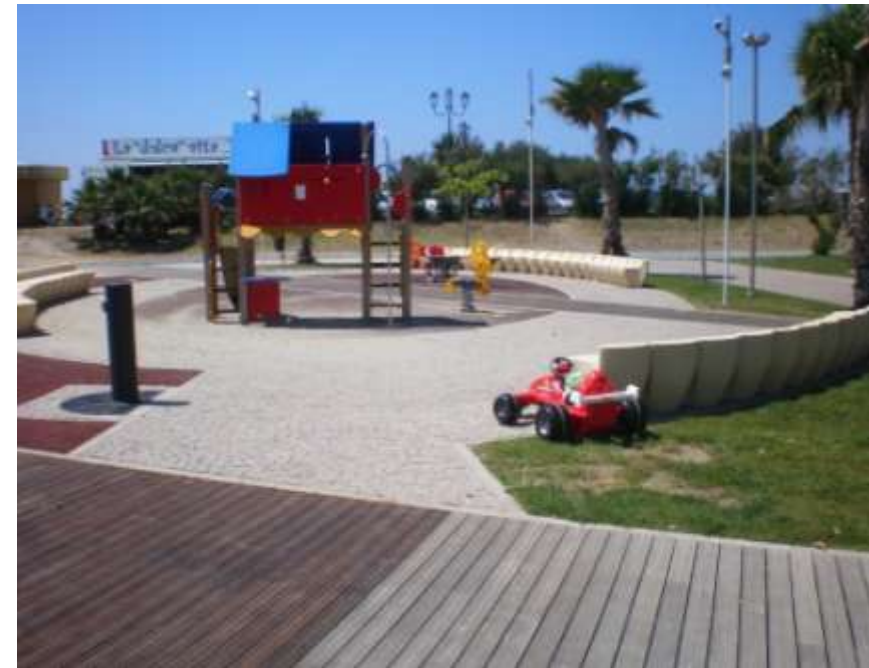
Realizzazione di un'area gioco bambini adiacente alla spiaggia pubblica