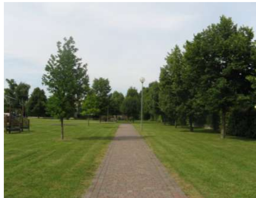
Riqualificazione dell'area verde di via Ragazzi '99