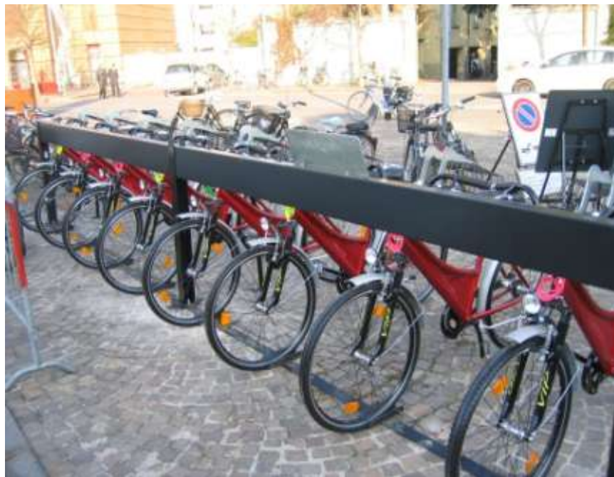
Realizzazione di postazioni per il bike sharing