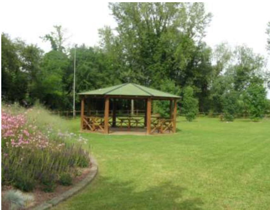
Riqualificazione dell'area verde di via Fontane