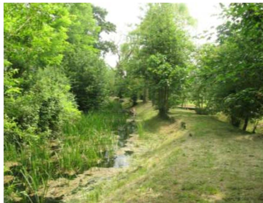
Interventi di manutenzione e miglioramento nella riserva naturale delle Fontane Bianche