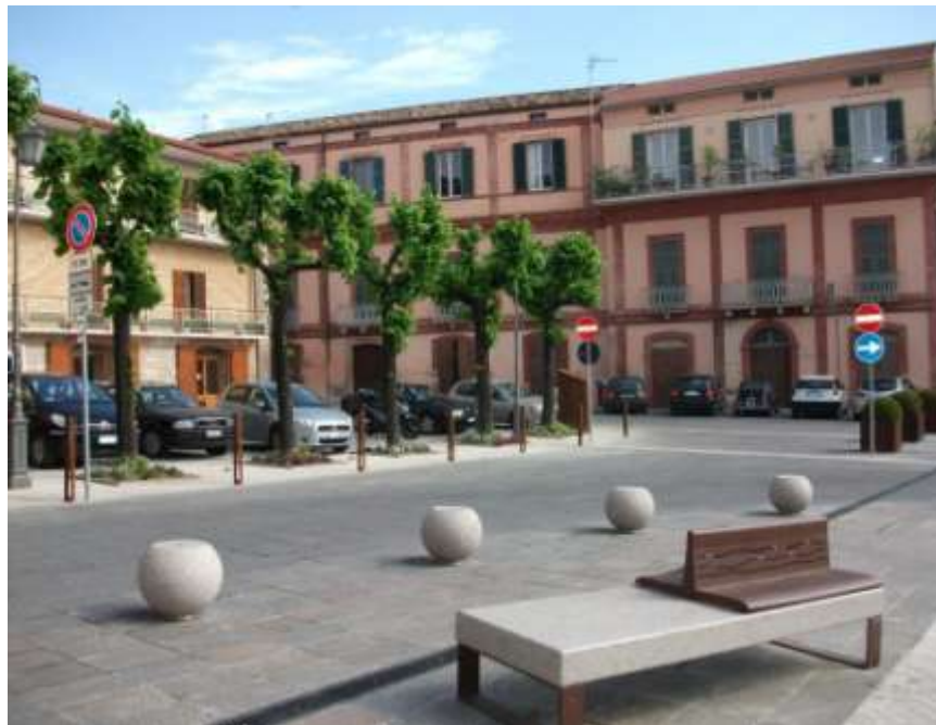
Riqualificazione di piazza Buozzi e corso Garibaldi