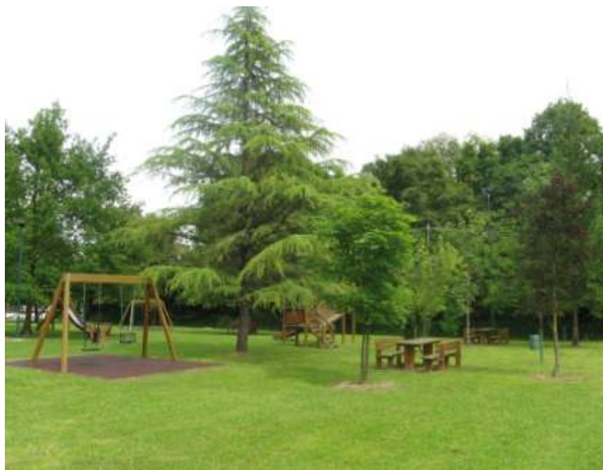
Riqualificazione dell'area verde di via Gorizia