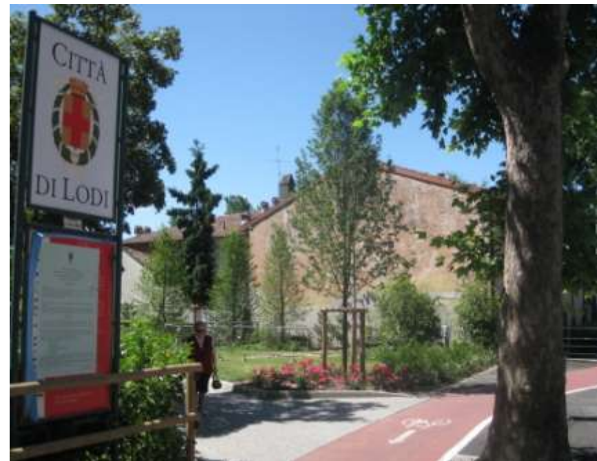
Riqualificazione dei viali alberati della città