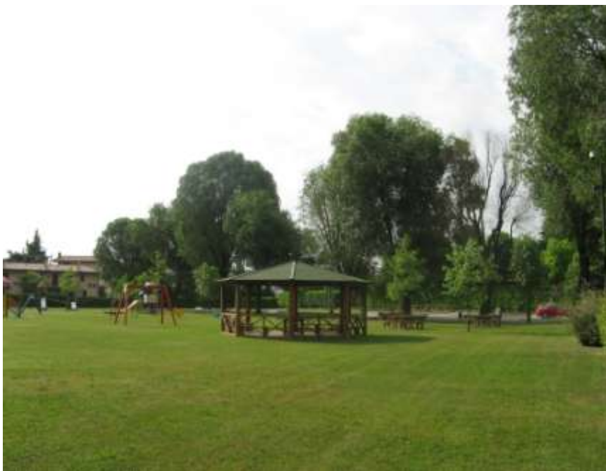
Riqualificazione dell'area verde di via Po