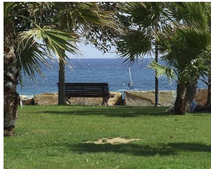
Riqualificazione dell'area "La Rabina"