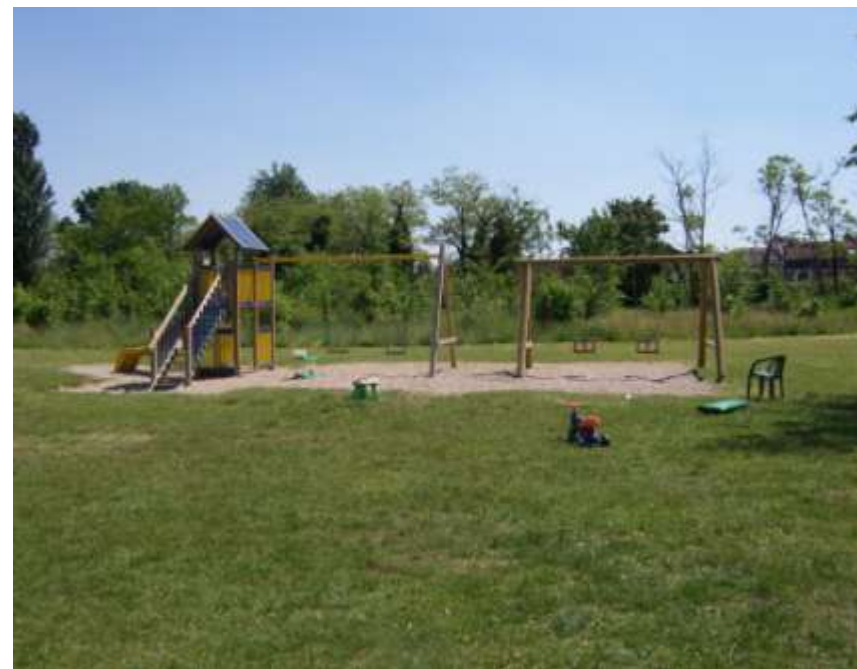
Realizzazione di un'area gioco nel Parco del Centenario