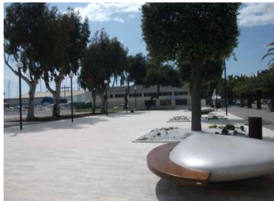
Riqualificazione della zona centrale del lido comunale