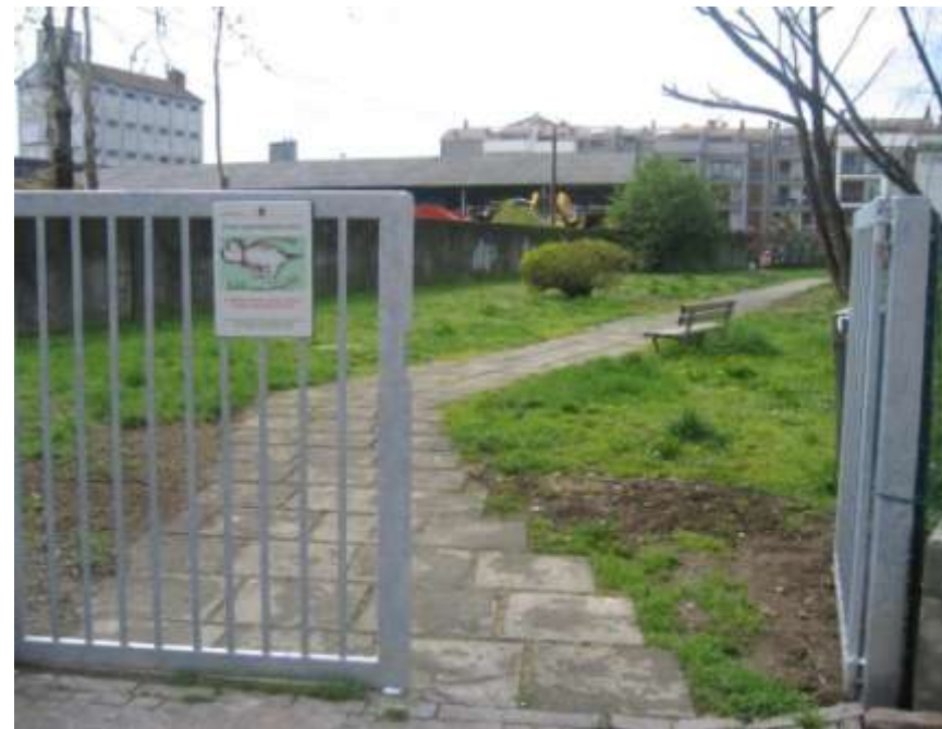
Realizzazione di un'area cani