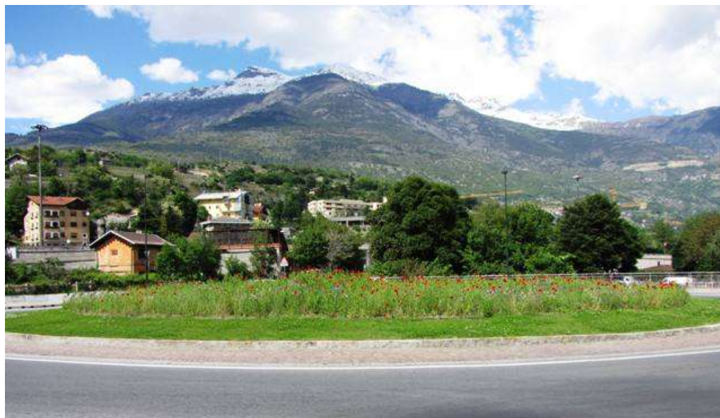
Allestimento della rotonda nel quartiere Dora a prato fiorito