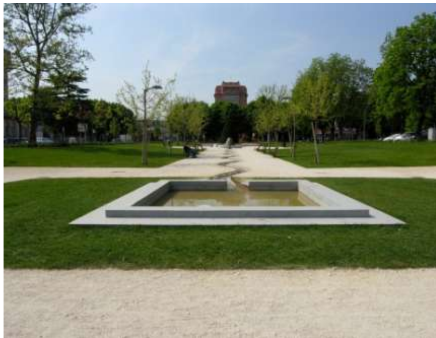
Riqualificazione del "Giardino del Passeggio"