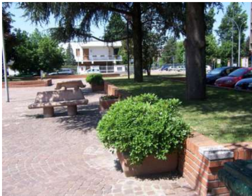
Riquilificazione di piazza San Lorenzo