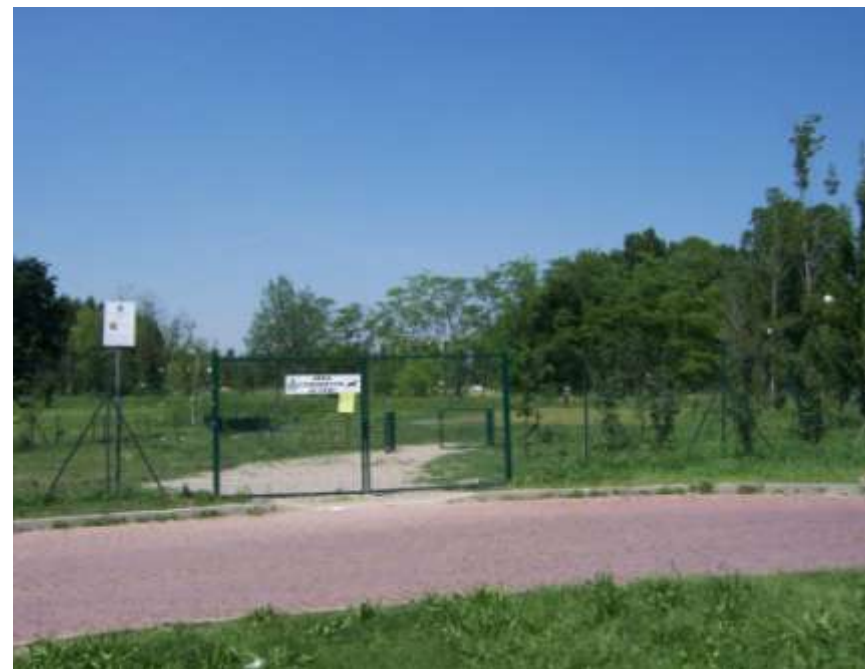
Realizzazione di un'area cani nel parco del Centenario