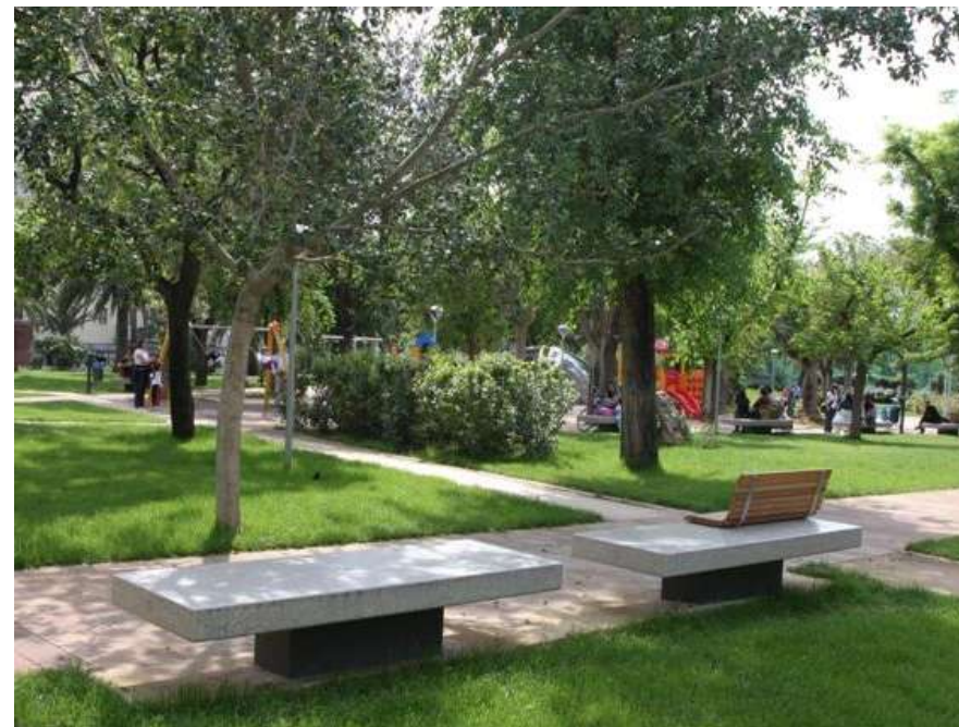
Riqualificazione del Parco Tarragona