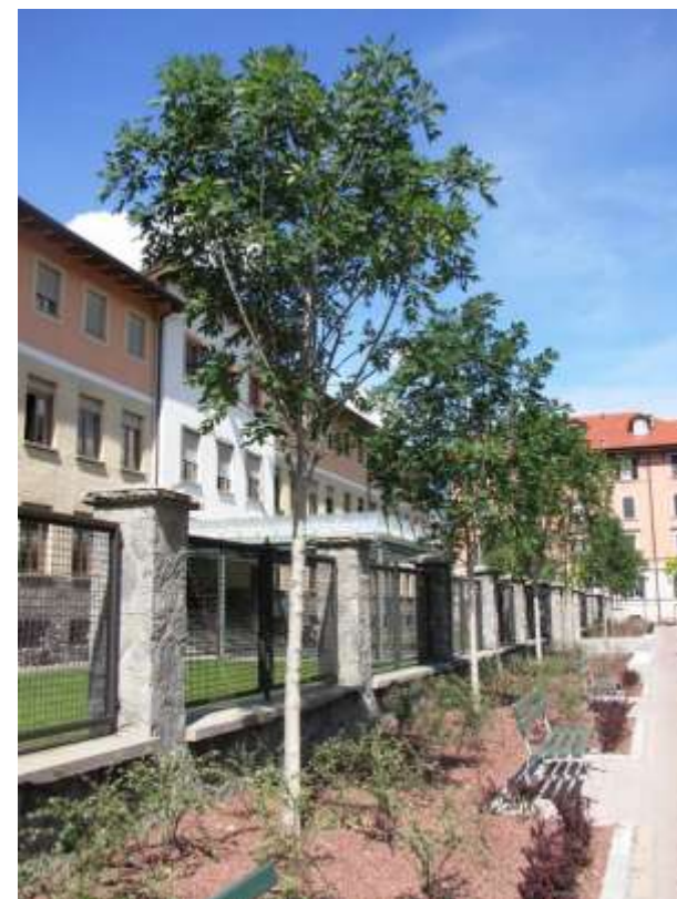
Riqualificazione dell'area di via Cavagnet