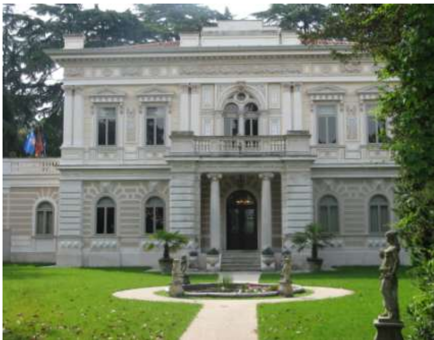
Riqualificazione del parco di Villa Giovannina