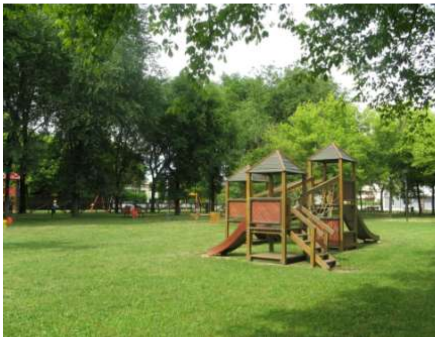
Riqualificazione dell'area verde di via Solferino