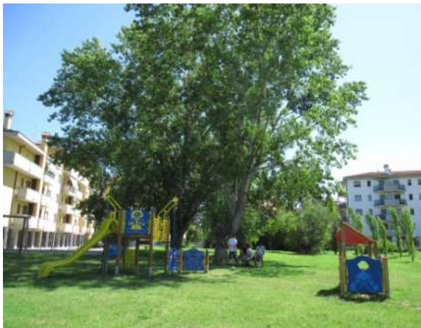
Realizzazione del Parco Caselle