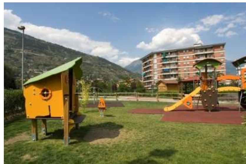
Realizzazione del parco Grand Eyvia