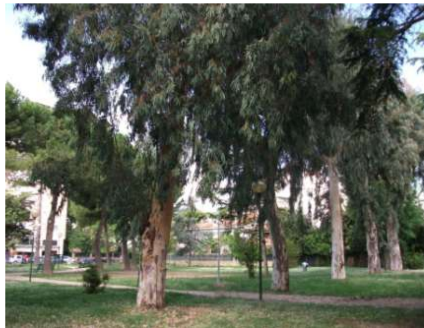
Riqualificazione del parco Franchi