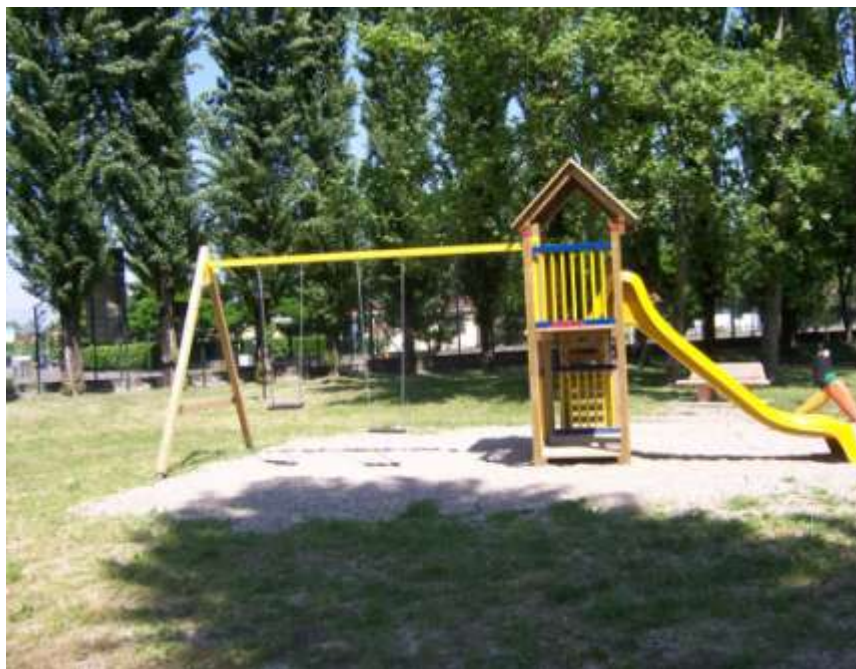
Riqualificazione dell'area gioco Parco della Noce