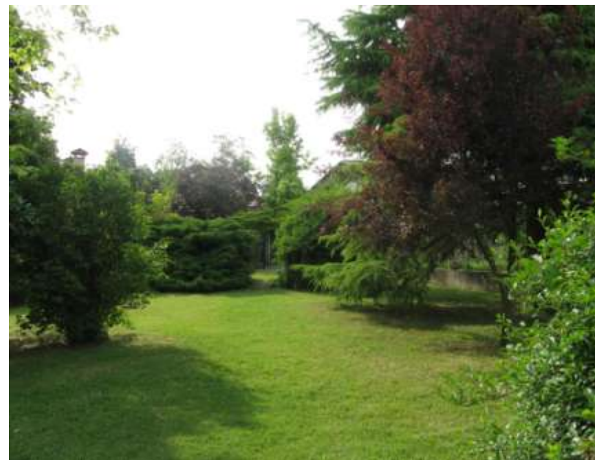
Riqualificazione dell'area verde di via Da Vinci