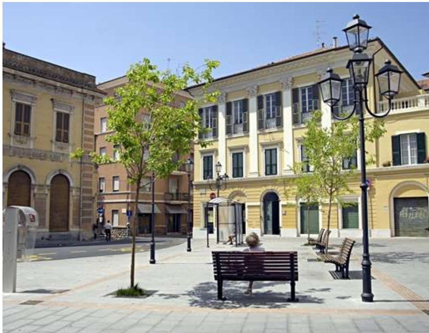
Riqualificazione di piazza Ricci