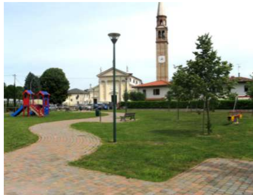
Riqualificazione dell'area verde di via Chiesa