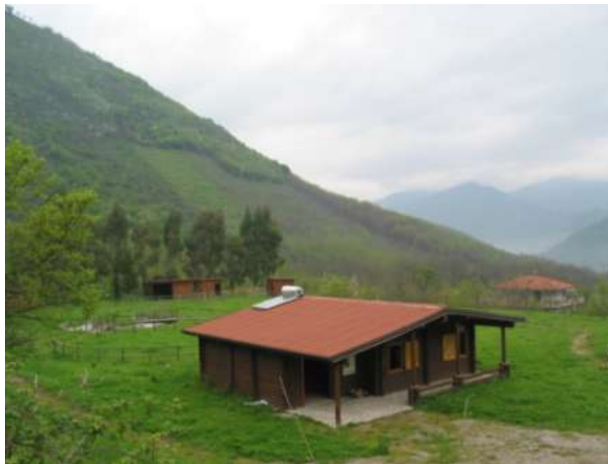
Realizzazione di una bio-fattoria