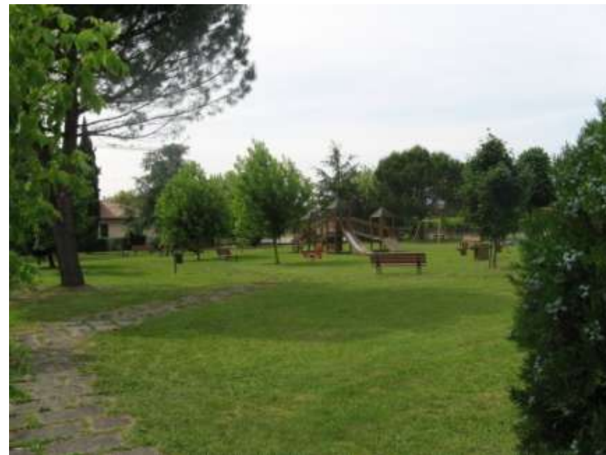
Riqualificazione dell'area verde di via Mons. Zanatta