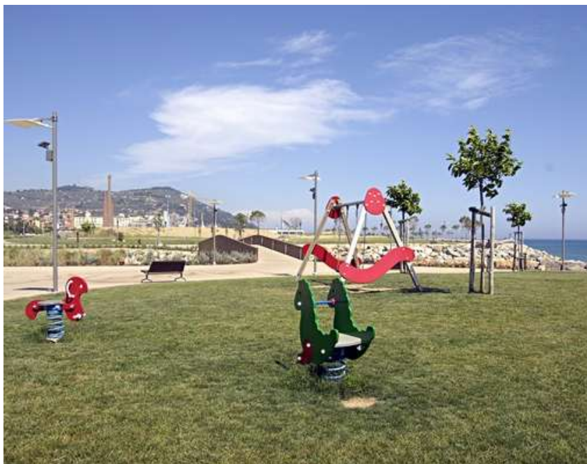
Realizzazione del Parco San Leonardo