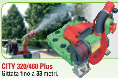
CITY 320/460 Plus Gittata fino a 33 metri.

Le Macchine Tifone assicurano Funzionalità, Comfort, Produttività e Sicurezza ai massimi livelli, frutto di oltre 50 anni di esperienza nel settore.