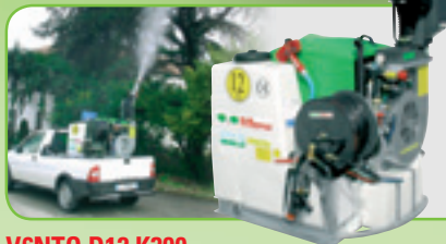
VENTO D12.K300 Gittata fino a 18 metri.