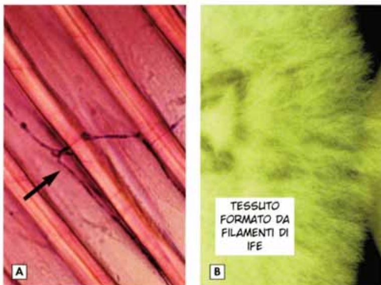
Figura 2: Molteplici cellule di fungo a forma di tubo l'una dietro l'altra costruiscono un filamento di ifa, che denominiamo semplicemente "ifa". A: una ifa di Heterobasidion annosum con ramificazione penetra attraverso diverse pareti cellulari legnose di un abete rosso. B. Tessuto di ife simile a ovatta (micelio) di un Basidiomicete in coltura.

La parete trasversale tra due cellule di ifa viene chiamata setto o septum . I filamenti dell'ifa crescono in lunghezza sulle estremità fino a che la cellula diventa molto lunga; a questo punto si inserisce semplicemente una nuova parete trasversale (la cosiddetta crescita apicale). I filamenti di cellula di ifa si possono anche ramificare, dando origine a fasci di fibre o a reticolati somiglianti ad ovatta (Figura 2).