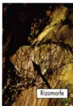
Figura 3: Un tessuto fungino viene anche denominato "micelio" (per esempio feltro miceliale di Fomes fomentarius ) e i cordoni miceliali ramificati, simili a una radice, vengono definiti "rizomorfe" (per esempio Armillaria spp.).