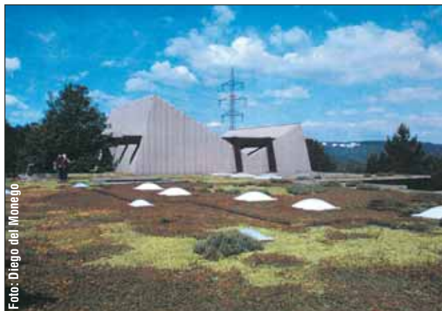
Cimitero comunale nella città di Esslingen (D).

sposti su terrazzamenti, doveva essere stata posta a dimora anche vegetazione arborea, come cipressi e palme. Per quanto è possibile desumere dall'iconografia, la vegetazione doveva essere lussureggiante, soprattutto se confrontata con l'arido territorio circostante. Poco si sa delle tecniche di realizzazione utilizzate.