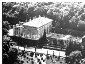
Da sinistra in senso orario, Villa Medici a Fiesole, il belvedere del Vaticano (incisione di M. Cartaro 1572), Villa Madama a Roma.