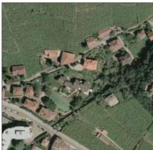
Impermeabilizzazione dei suoli.