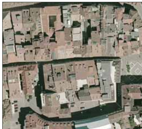
Aumento della densificazione urbana e impermeabilizzazione crescente dei suoli (Estratto da ortofotocarta 1:5.000. Compagnia Generale Riprese aeree - IT 2000, Parma, 2000).