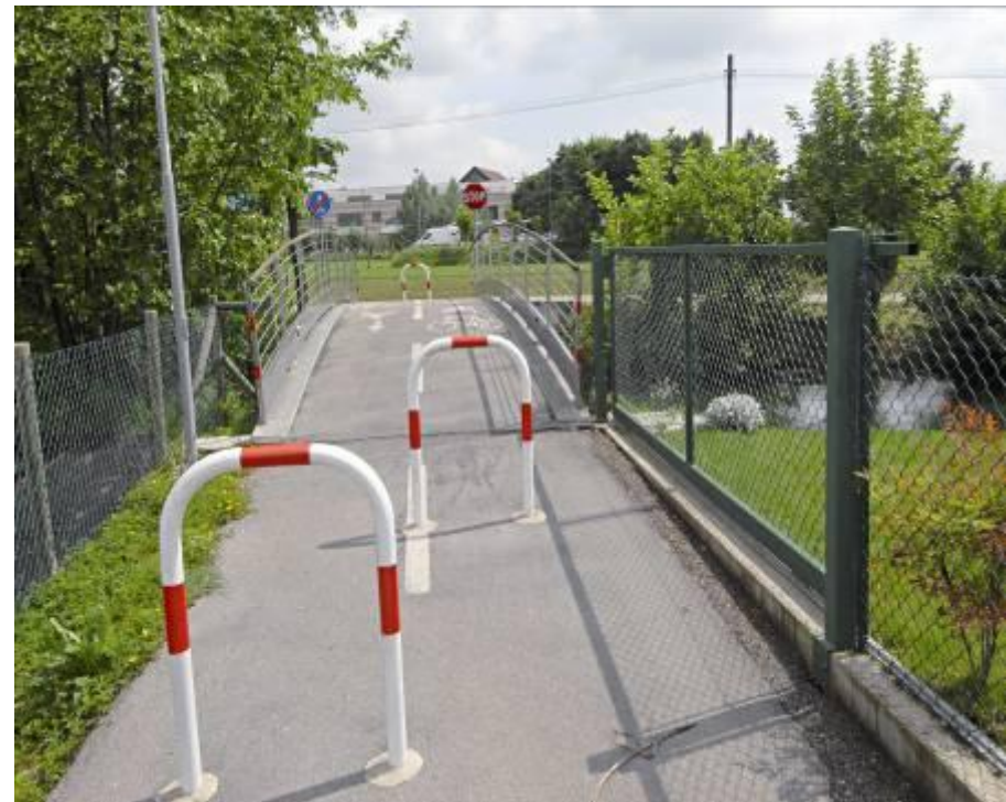
Pista ciclabile che collega le varie frazioni del comune COMUNE DI BOLZANO VICENTINO - 2ª categoria