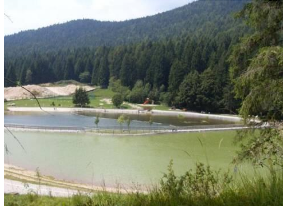
Realizzazione di un biolago balneabile e attrezzato COMUNE DI ROANA- 1ª categoria

➤ UTILIZZO DI SOLUZIONI TECNICHE INNOVATIVE RISPETTOSE DELL'AMBIENTE