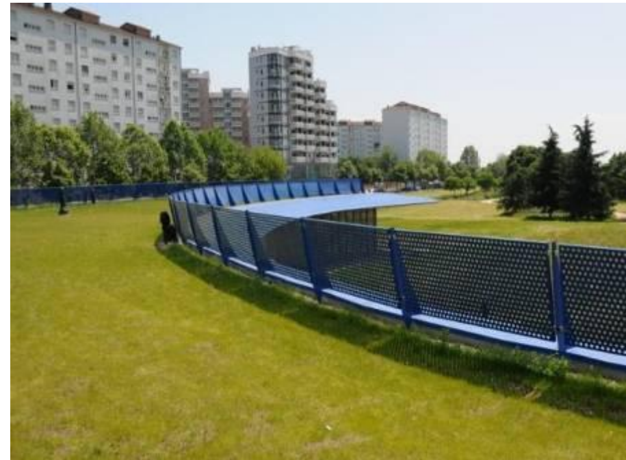
Tetto verde pensile sopra la Casa parco Colonnetti COMUNE DI TORINO - 4ª categoria