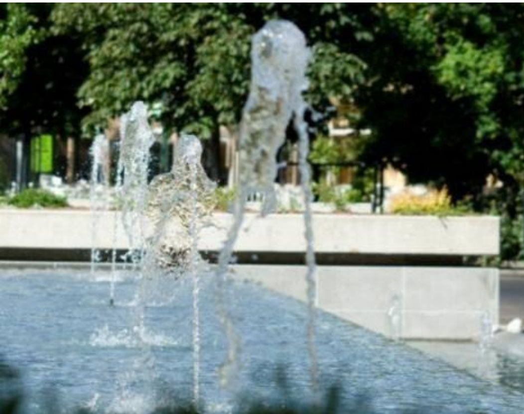
Vasche d'acqua nella piazza Repubblica COMUNE DI COLLECCHIO - 4ª categoria

➤ INSERIMENTO ELEMENTI DI ARREDO SOFISTICATI E INNOVATIVI PER FAVORIRE UNA FRUIBILITA' DIVERSIFICATA, CREARE EFFETTI ESTETICI, REGOLARE IL MICROCLIMA