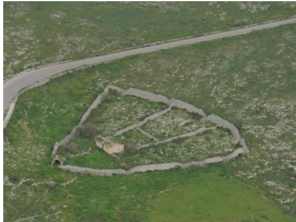
Zona della quite dopo gli interventi di pulizia COMUNE DI SANTERAMO IN COLLE - 3ª categoria