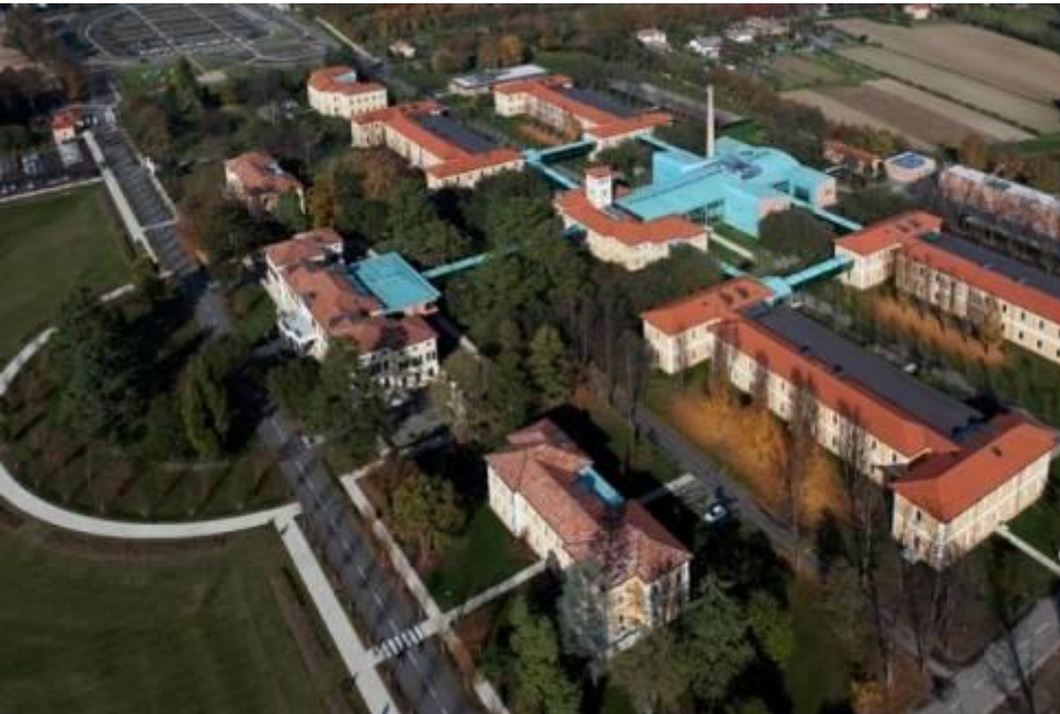
Complesso dell'ex ospedale neuropsichiatrico San Artemio ora sede della Provincia PROVINCIA DI TREVISO - 4ª categoria

➤ RIQUALIFICAZIONE DI AREE ABBANDONATE E DEGRADATE FACENTI PARTE DI COMPLESSI DISMESSI