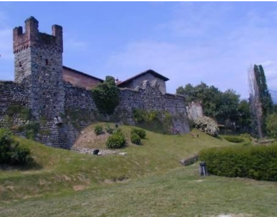
Area medievale che circonda la rocca del Ricetto COMUNE DI CANDELO - 2ª categoria

➤ RIQUALIFICAZIONE E RIFUNZIONALIZZAZIONE DI SITI AMBIENTALI, NATURALISTICI, STORICO CULTURALI