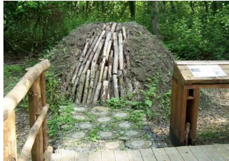
Ricostruzione di una carbonaia della tradizione locale ENTE PARCO SRMM - 5ª categoria

➤ RECUPERO E SALVAGUARDIA DELLA MEMORIA STORICA DEI LUOGHI