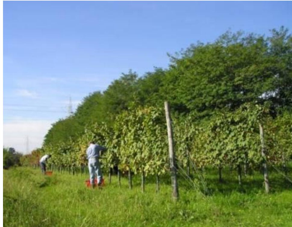
Laboratorio biogenetico e didattico che ripropone gli antichi metodi di cultura della vite COMUNE DI CANDELO - 2ª categoria

➤ DIFFUSIONE TRA IL VASTO PUBBLICO DI CONOSCENZE TECNICHE RIGUARDO LA BIODIVERSITÁ AGRICOLA