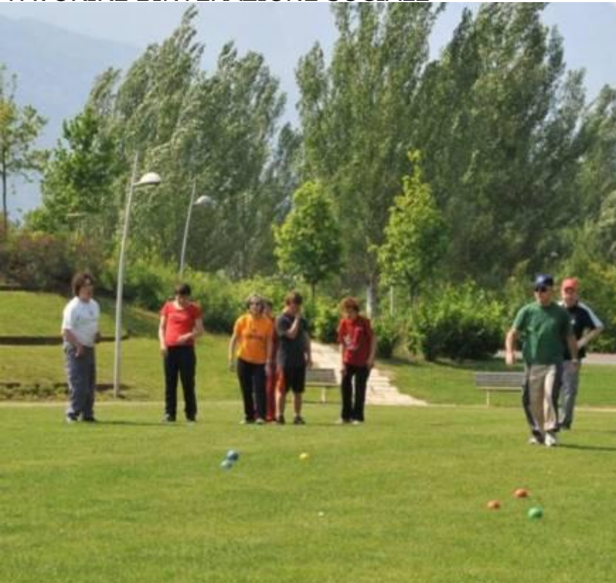
Gioco delle bocce nel parco Melta COMUNE DI TRENTO 4ª categoria

UTENZA: AMPIA E DIVERSIFICATA PER FAVORIRE L'INTERAZIONE SOCIALE