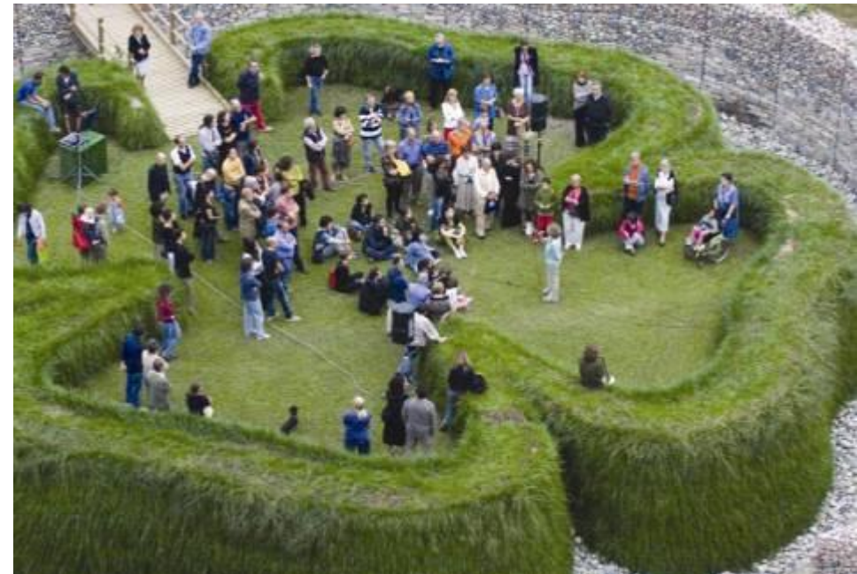
Evento pubblico all'interno del PAV, il parco d'arte vivente COMUNE DI TORINO - 4ª categoria