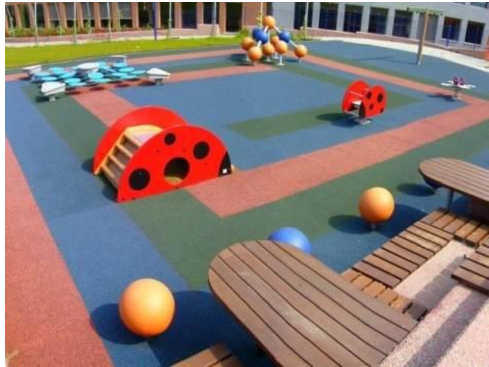
Area gioco nel giardino di Villa Glori COMUNE DI TORINO - 4ª categoria

➤ PAVIMENTAZIONI: SINTETICHE, COLORATE, CONTRASTANTI, TEMATIZZATE O NATURALI CON MATERIALI VEGETALI E ANTITRAUMA, CONTINUATIVE