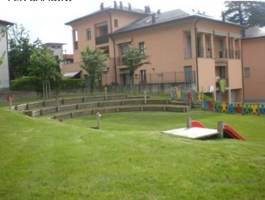
Anfiteatro naturale nel giardino dell'asilo Mago Libero COMUNE DI ERBA - 3ª categoria

➤ ATTREZZATURE: GIOCHI INNOVATIVI, IN METALLO O LEGNO NATURALE; SUPERFICI INERBITE MULTIFUNZIONALI, PENDENZE DESTINATE AL GIOCO LIBERO; PISTE CICLABILI PER BAMBINI