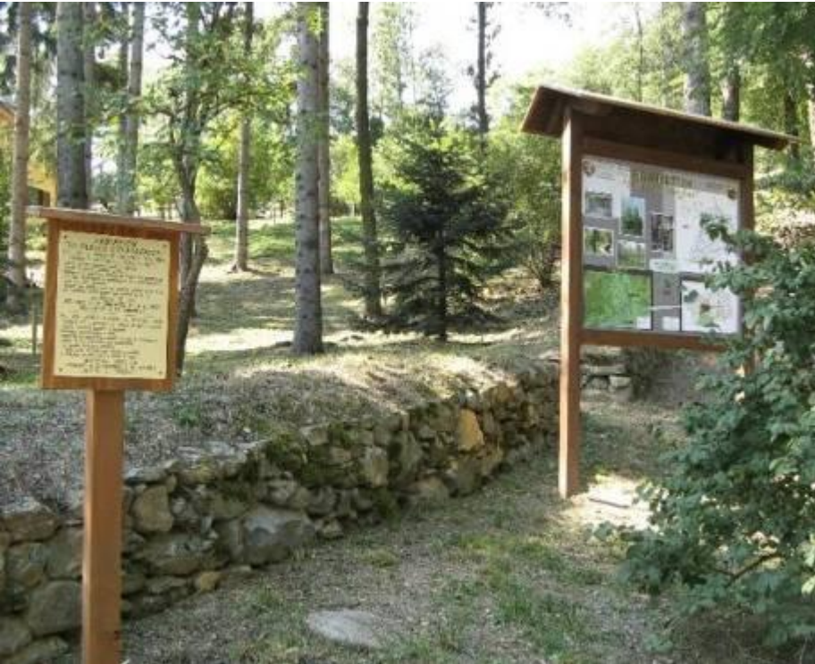
Arboreto di Entrebin che accoglie quasi 200 specie vegetali COMUNE DI AOSTA - 3ª categoria

➤ DIFFUSIONE DELLA CONOSCENZA DELLE SPECIE E VARIETÁ VEGETALI IN AMBIENTE URBANO