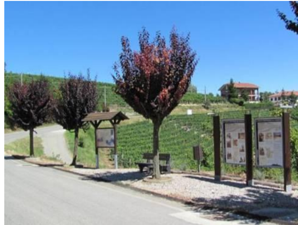
Realizzazione del museo contadino "Vinchio e le colline della Barbera" COMUNE DI VINCHIO - 1ª categoria

➤ VALORIZZAZIONE DI ANTICHI PERCORSI RURALI