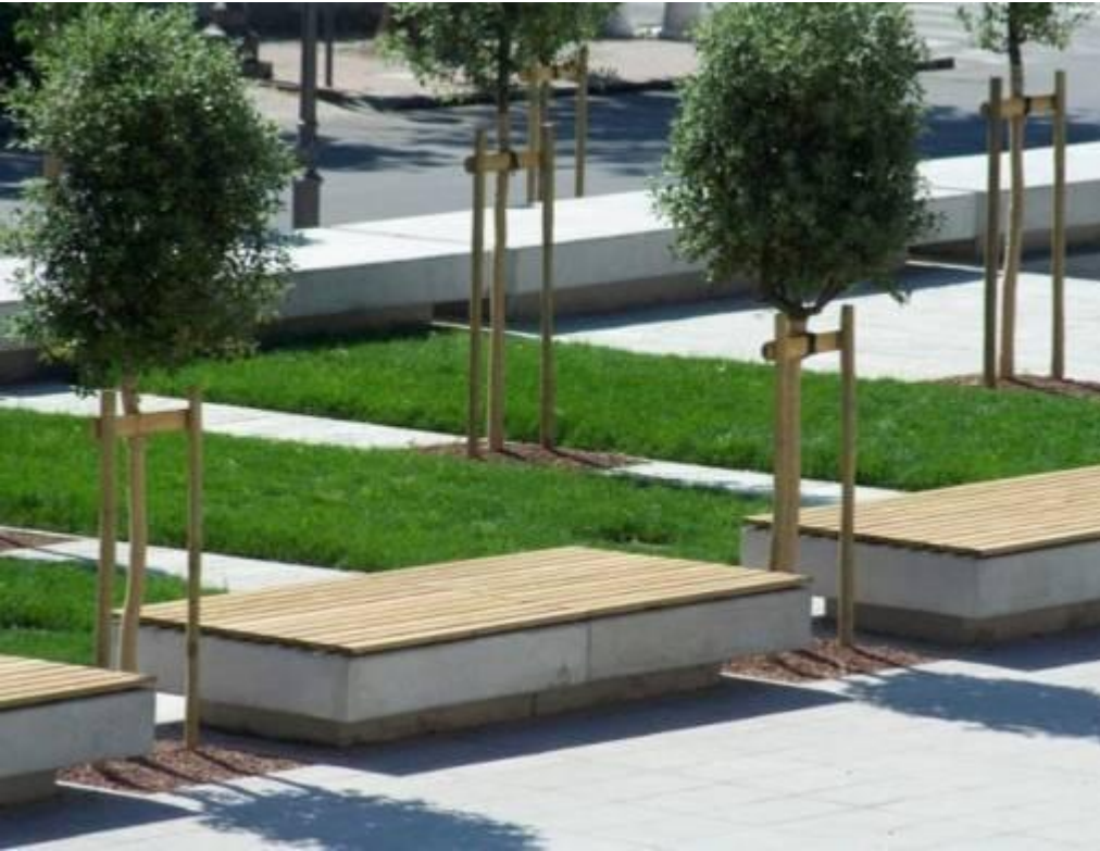
Piazza Repubblica COMUNE DI COLLECCHIO - 2ª categoria