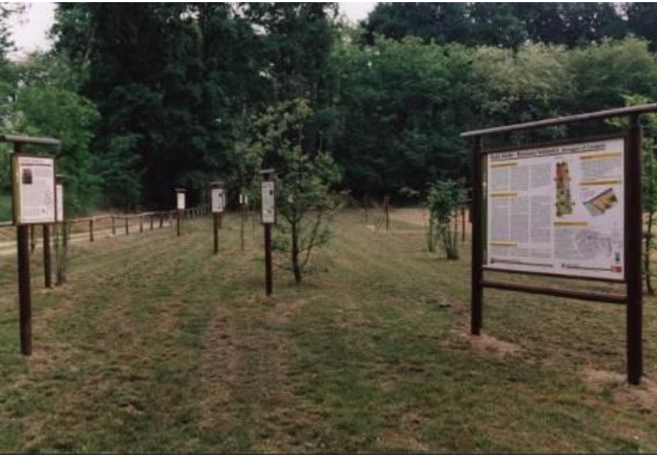
"Aula Verde" all'interno della Riserva naturale delle Baragge PROVINCIA DI CANDELO - 1ª categoria

➤ REALIZZAZIONE DI PERCORSI E STRUTTURE DIDATTICHE ALL'APERTO