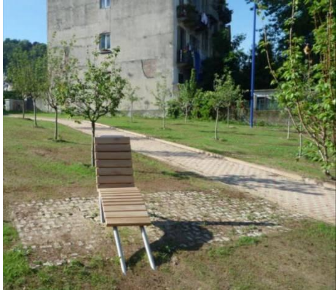
Alberi da frutto nel giardino di Villa Glori COMUNE DI TORINO - 4ª categoria

➤ INSERIMENTO DI ALBERI DA FRUTTO NEGLI SPAZI URBANI