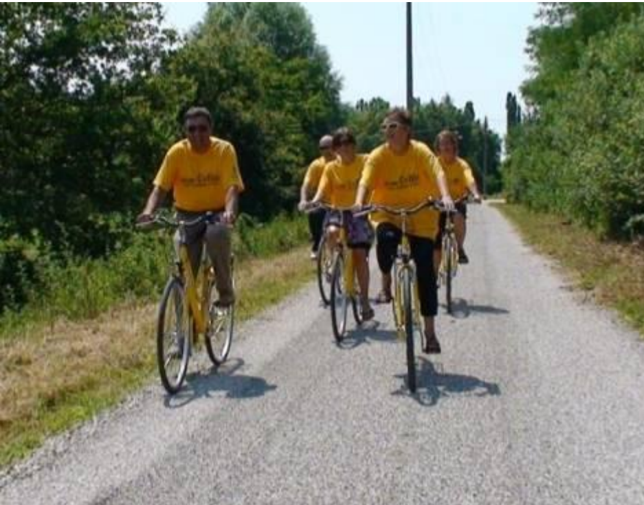
Biciclette a uso dei cittadini PROVINCIA DI GORIZIA - 5ª categoria

➤ BIKE SHARING, NOLEGGIO GRATUITO DI BICI