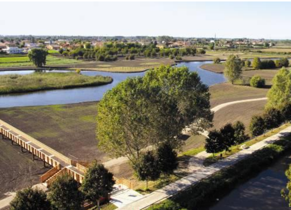
Passerella ciclopedonale che collega le due parti della città attraversata dal fiume Menago COMUNE DI CERA - 3ª categoria