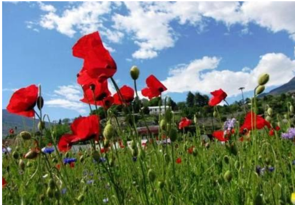
Rotonda stradale con wildflowers COMUNE DI AOSTA - 4ª categoria