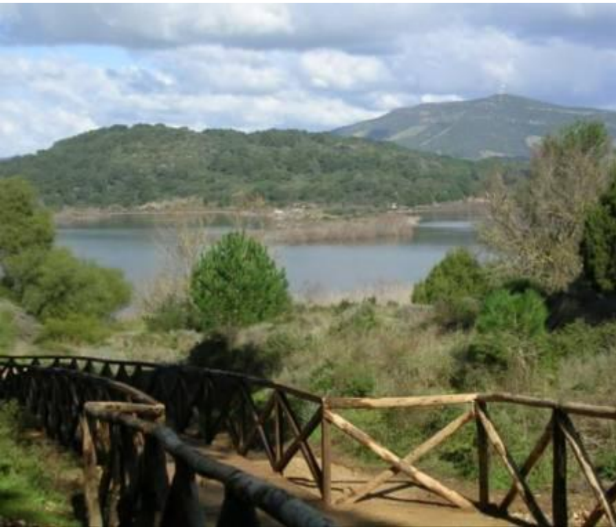
Sito del Lago di Baratz dopo le azioni di recupero COMUNE DI SASSARI 4ª categoria

➤ RIQUALIFICAZIONE DI SITI NATURALISTICI E RIPRISTINO DI CONNESSIONI TRA LE COMPONENTI NATURALI