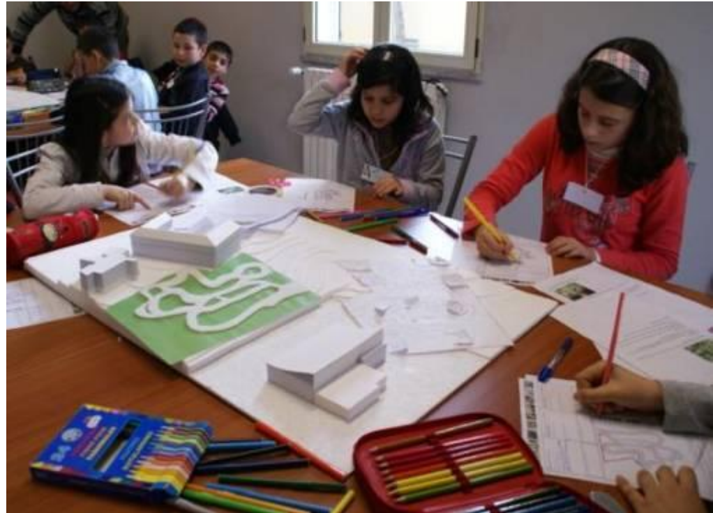
Progettazione del parco ciclabile "Ruote scintillanti" con i bambini dell'Istituto Comprensivo Vittorio Angius COMUNE DI SERRENTI - 2ª categoria

➤ PROGETTAZIONE PARTECIPATA (CITTADINI, BAMBINI, INSEGNATI)