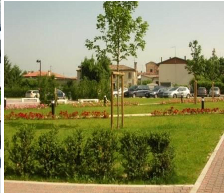
Piazza Trentin COMUNE DI CONA - 1ª categoria