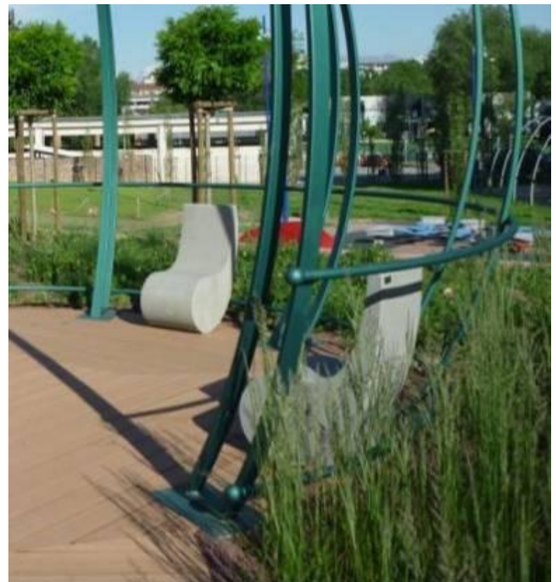
Tempietto all'interno del giardino di Villa Glori COMUNE DI TORINO - 4ª categoria