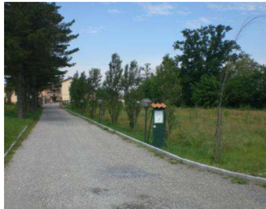
Nuovo impianto arboreo a seguito del recupero di Cascina Colombarola