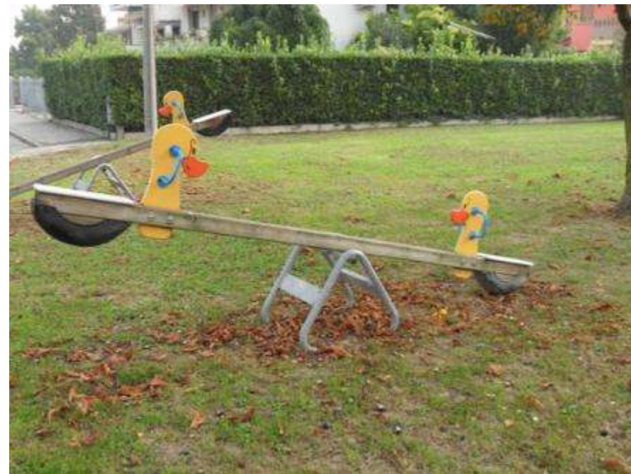
Sistemazione dell'area gioco bambini