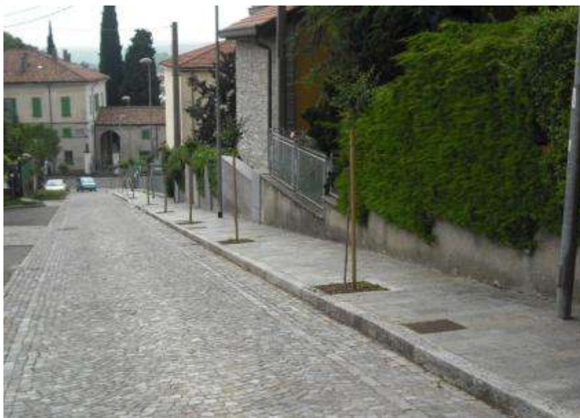
Riqualficazione di un viale alberato cittadino