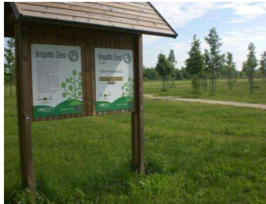
Realizzazione de "La Grande Foresta"