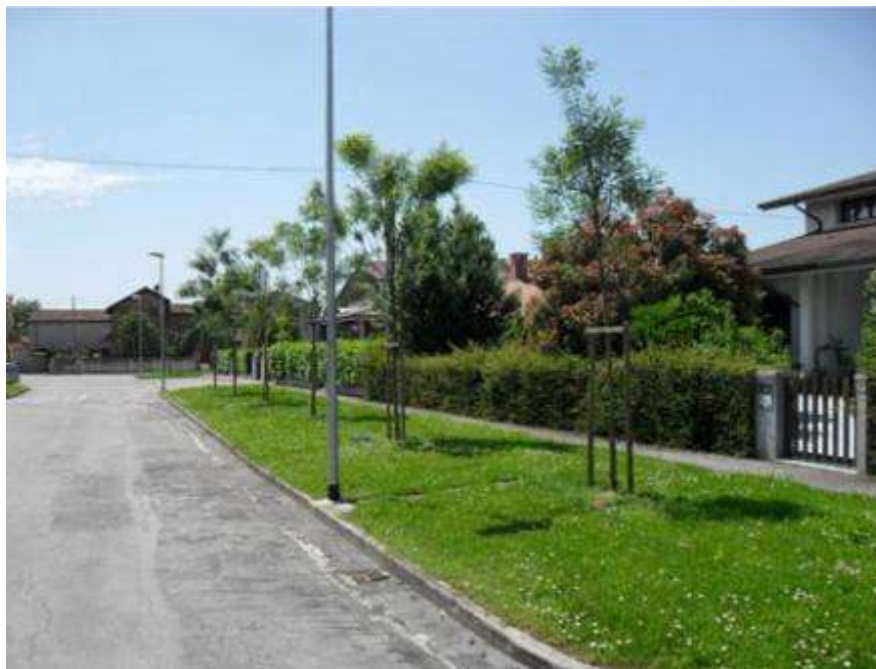
Messa a dimora di alberi nelle aree verdi comunali