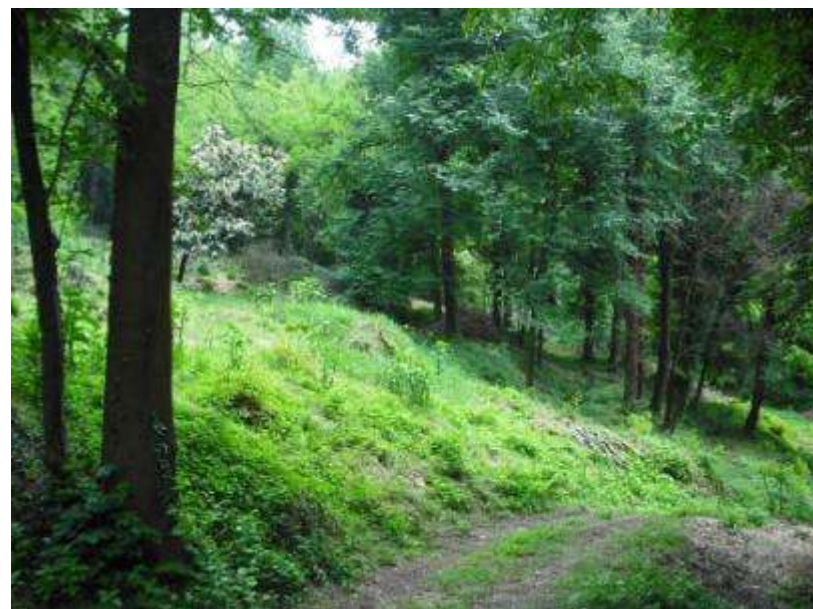
Sistemazione di un bosco