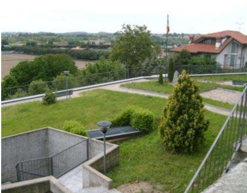
Sistemazione a verde dell'area del parcheggio interrato