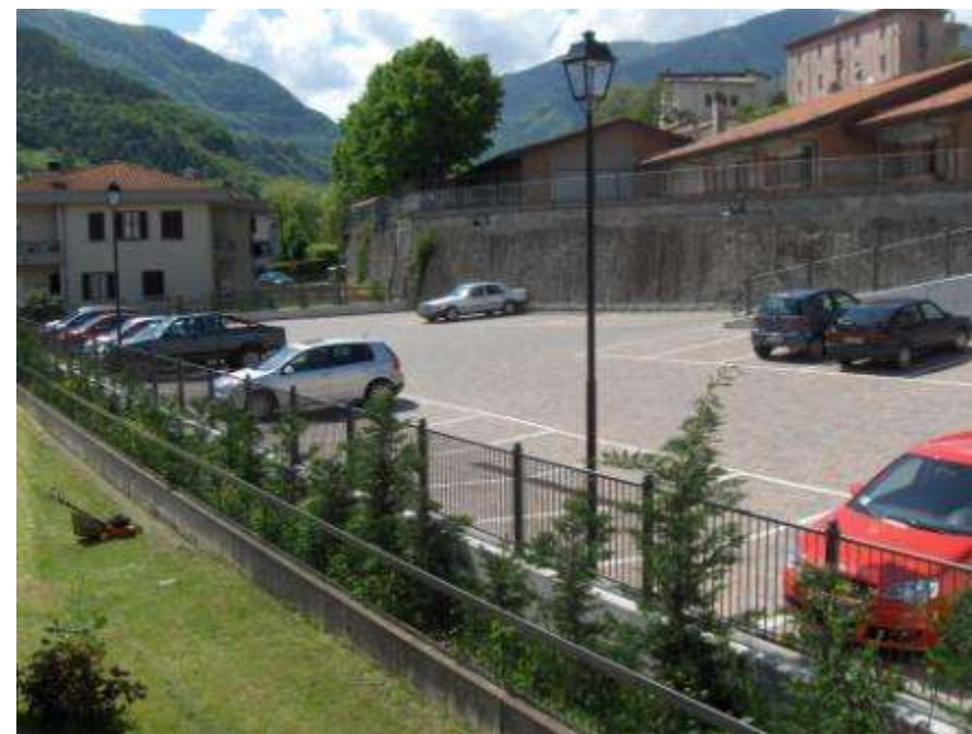
Piazza XXV Aprile prima e dopo l'intervento di riqualificazione