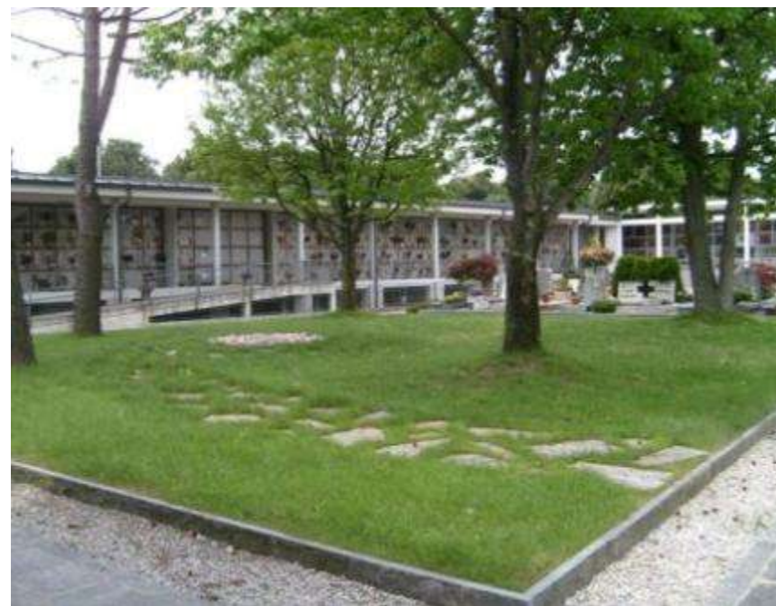
Area dispersione ceneri all'interno del cimitero comunale