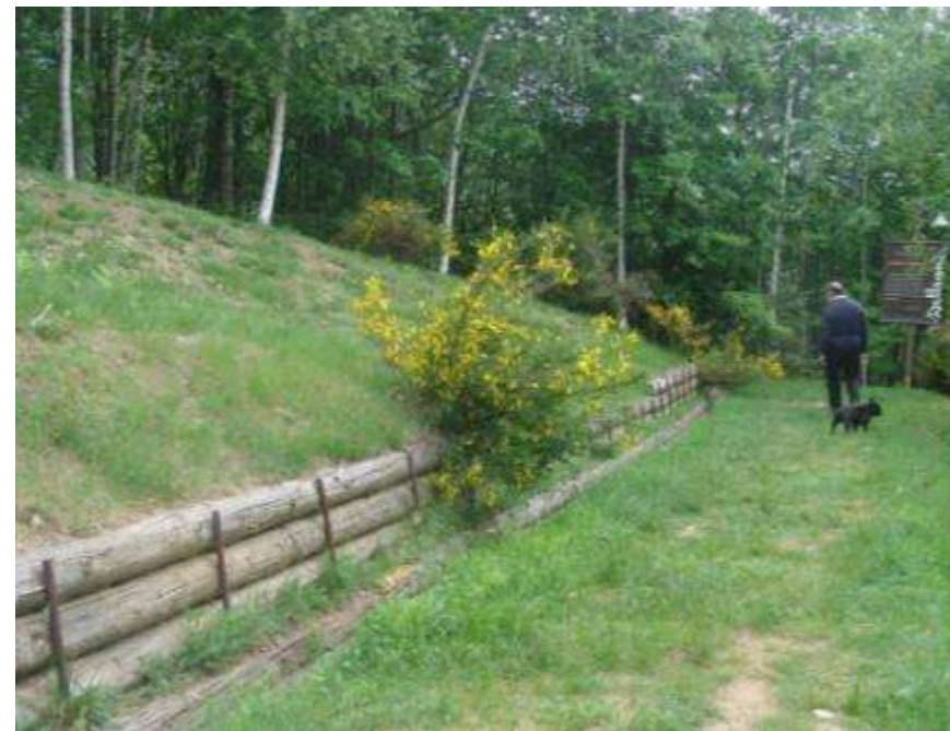
Sistemazione del sentiero per la sommità del Colle S. Barnaba