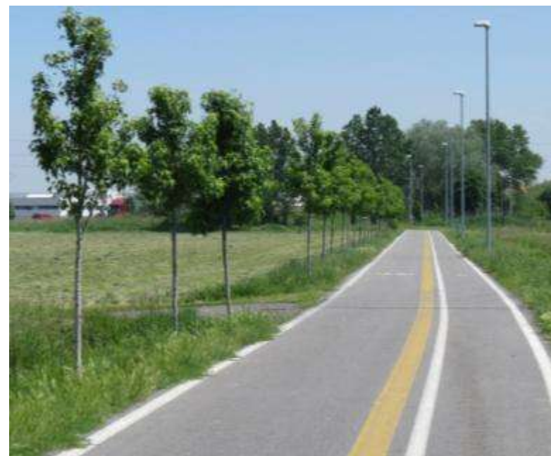
Messa a dimora di filari di alberi lungo la pista ciclabile