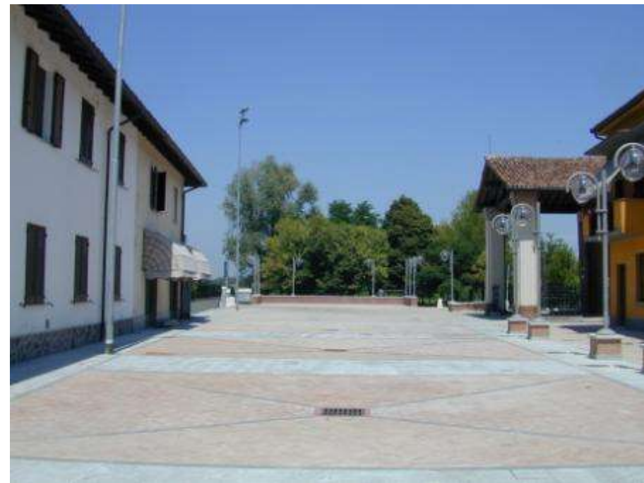
Riqualificazione di piazza Santa Maria e piazza Martiri della Libertà