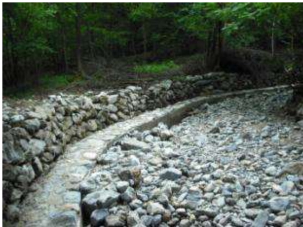
Lavori di rinforzo delle sponde del torrente Valloni