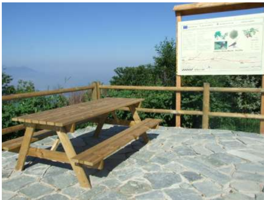
Riqualificazione sentiero "Madonna dell'Arco-Pietra Maula"