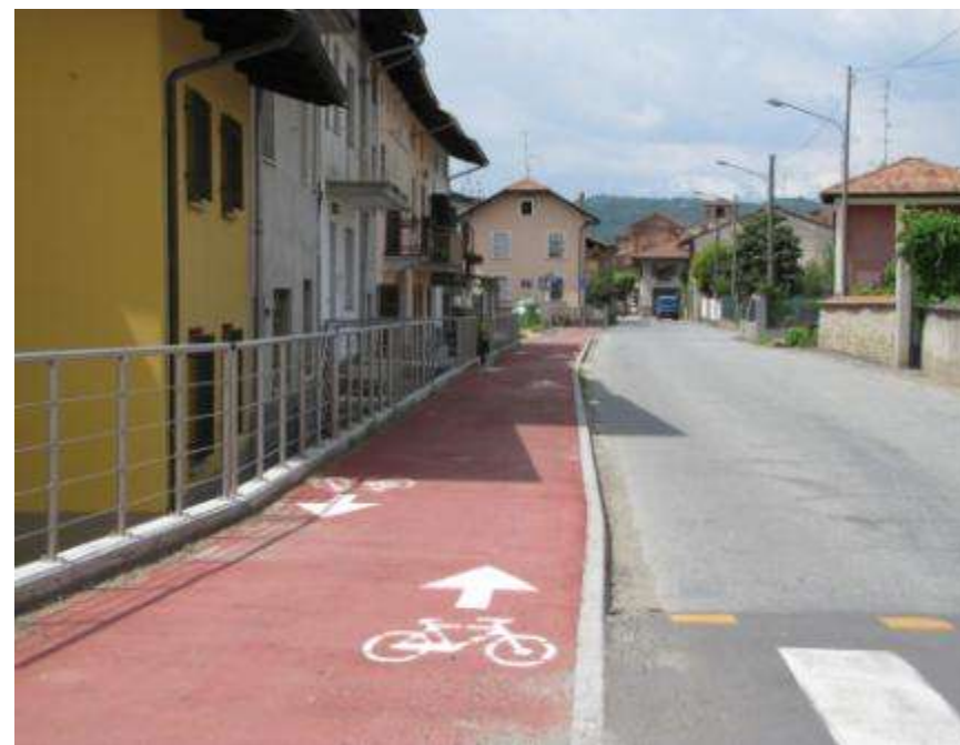
Realizzazione di una nuova pista ciclabile