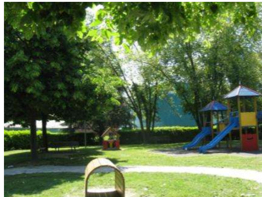
Riqualificazione del Parco di Vittorio