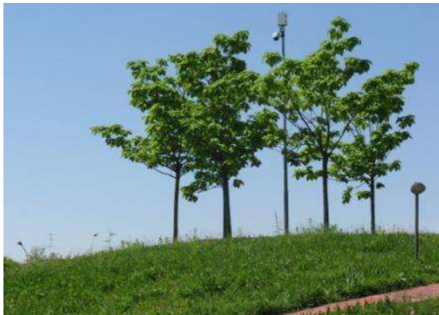
Realizzazione del Parco Aironi