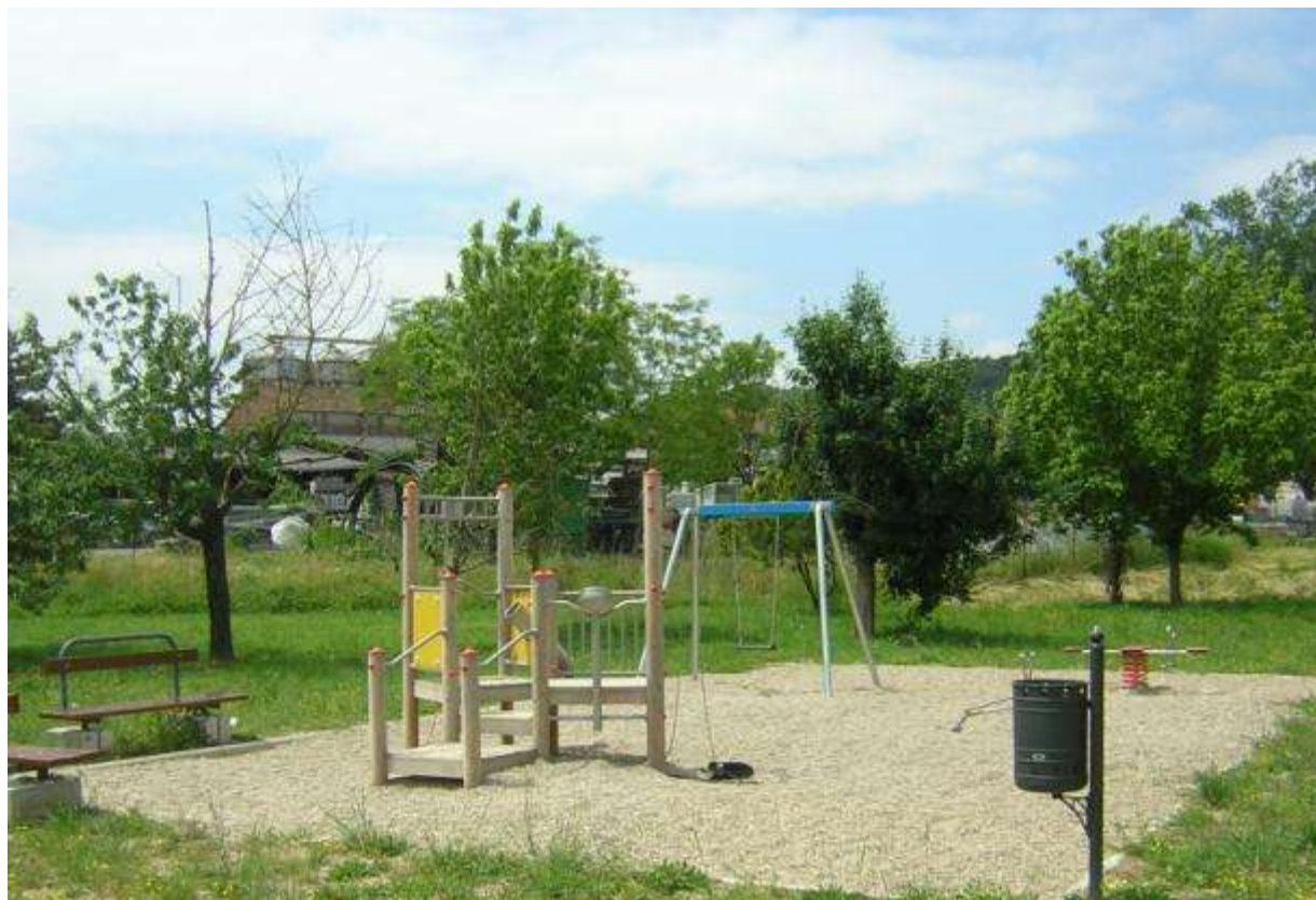
Realizzazione di un'area gioco bambini