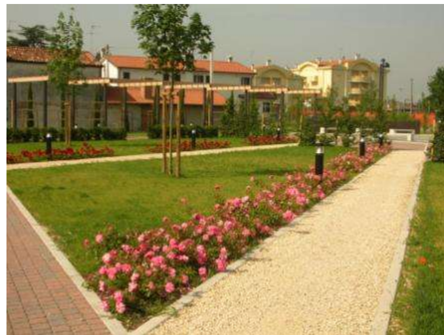
Piazza Trentin prima e dopo l'intervento di sistemazione a verde