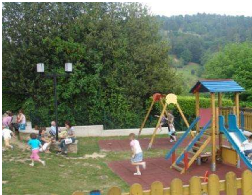
Realizzazione di un'area gioco all'interno del Parco Burcina