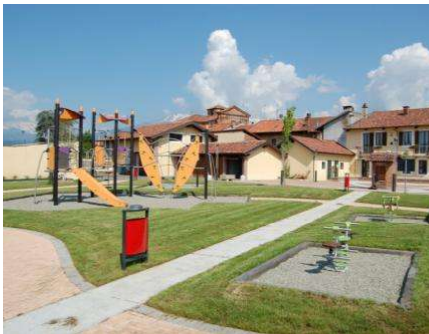
Realizzazione di un'area gioco per i bambini