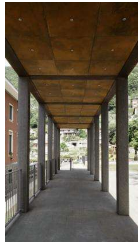
Riqualificazione delle aree esterne di Palazzo Simoni Fe