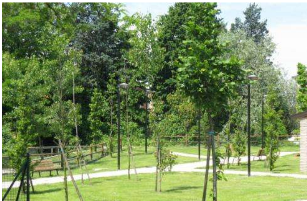
Riqualificazione di un'area urbana con giardini, area cani e parcheggio