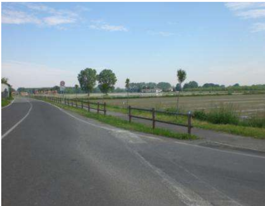
Realizzazione di piste ciclopedonali