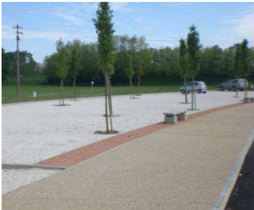
Realizzazione di uno spazio pubblico nella frazione Boschi