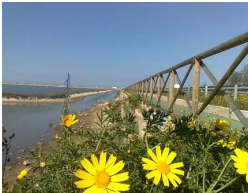
Realizzazione di piste ciclabili