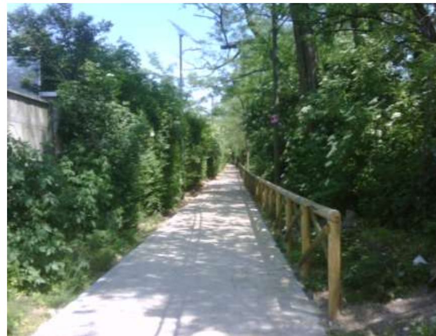
Riqualificazione della pista ciclopedonale "Viottolo Vignazza"