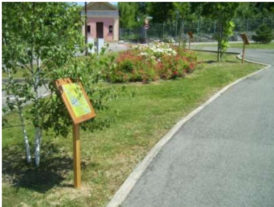
Realizzazione di un percorso didattico con pannelli informativi