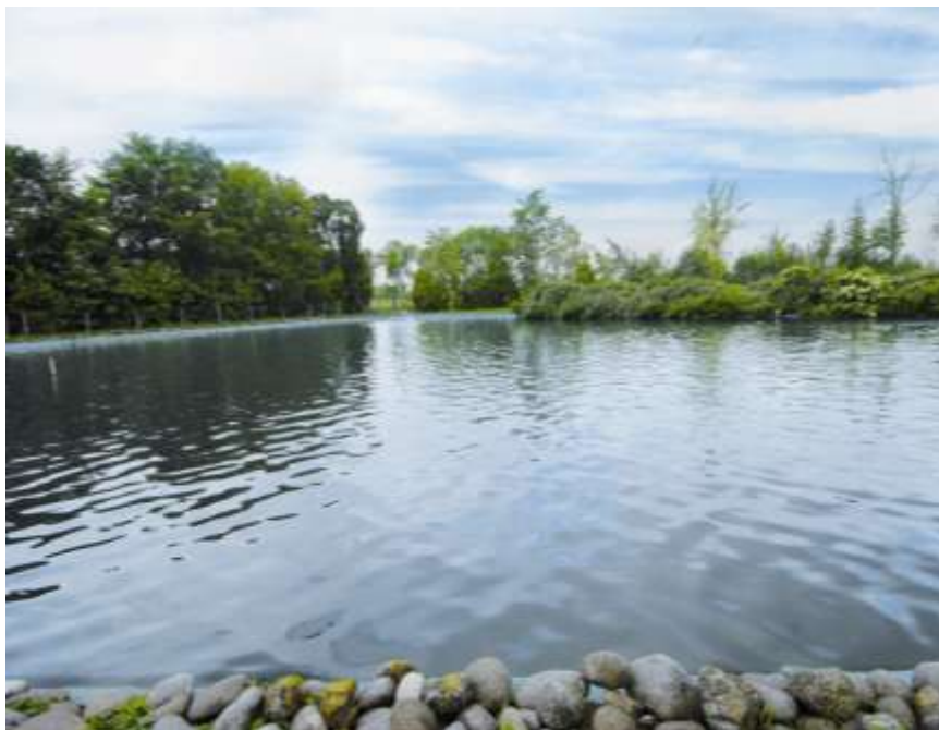
Realizzazione di un impianto di fitodepurazione