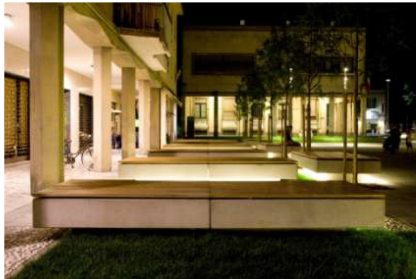
Creazione di luoghi di sosta ombreggiati nella zona residenziale adiacente la piazza