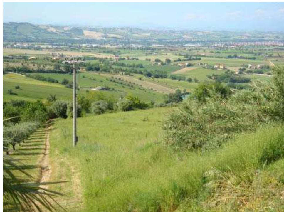
Messa a dimora di essenze autoctone su un'area di 8000 mq