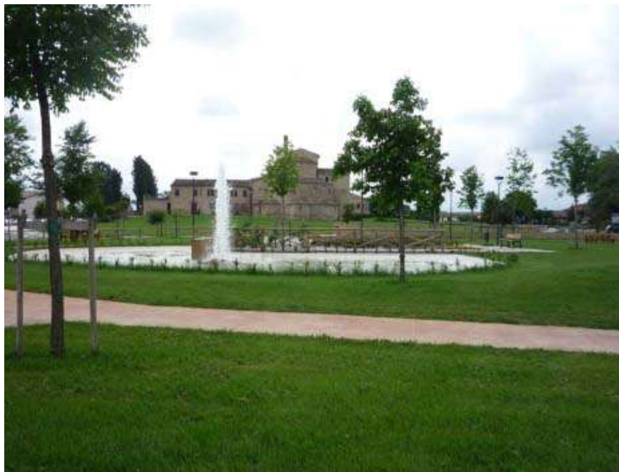
Realizzazione del Parco urbano dell'Annunziata