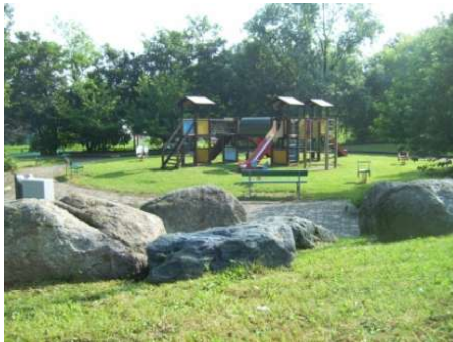
Riqualificazione di un parco giochi