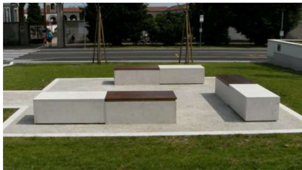
Riqualificazione della piazza nell'area del sagrato della chiesa di Santa Maria del Suffragio