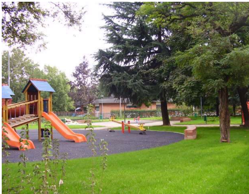
Riqualificazione di un parco urbano con area gioco