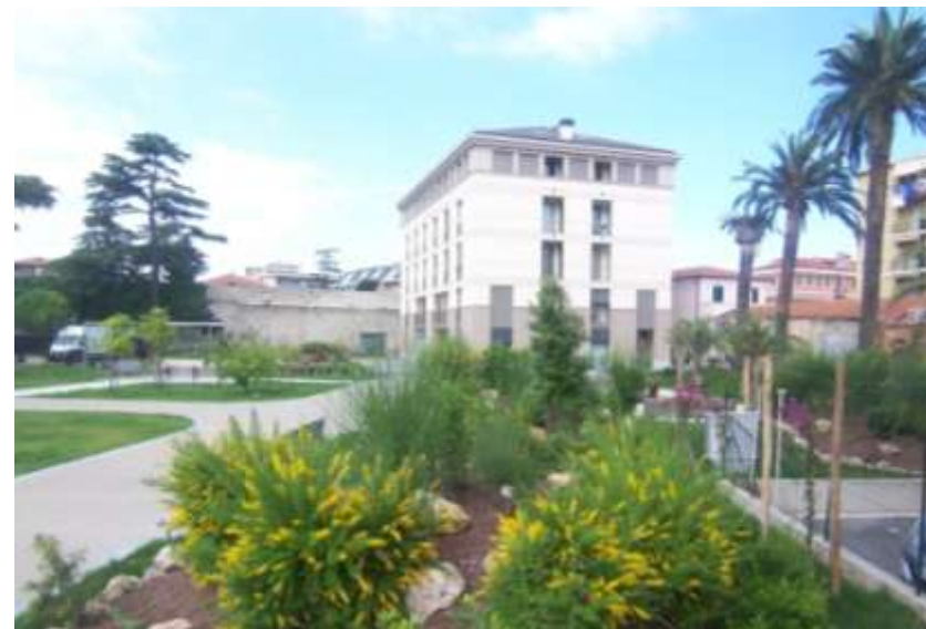
Realizzazione dei Giardini Josemaria Escrivà