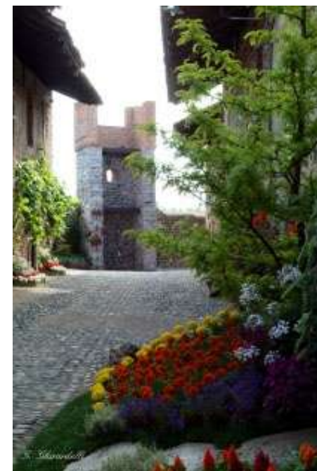
Manifestazione "Candelo in Fiore"