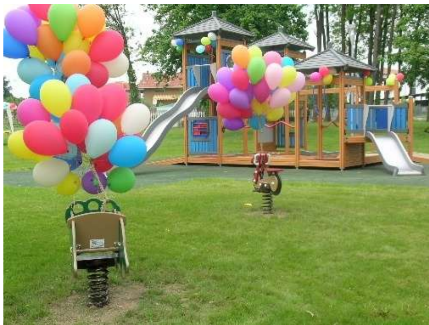
Realizzazione dell'area gioco bambini "Parco dell'Albero d'Oro"