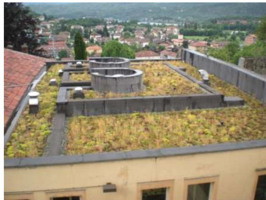
Realizzazione di un giardino pensile sopra i locali del Giudice di Pace e la Sala Consigliare