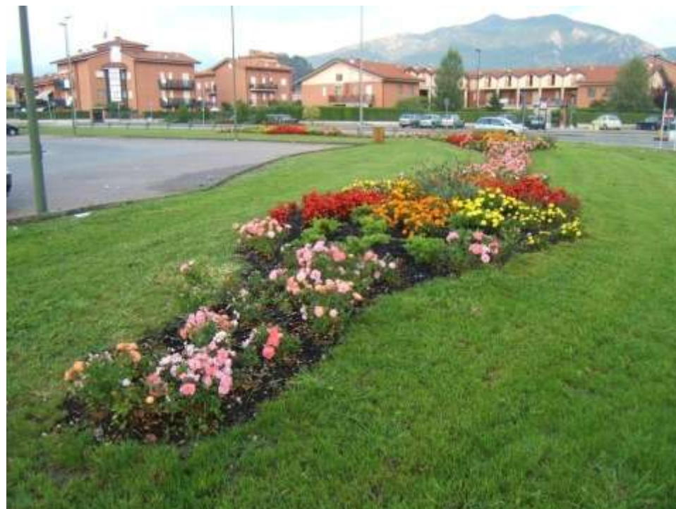
Realizzazione di una rotatoria dedicata al ciclista Giovanni Valetti