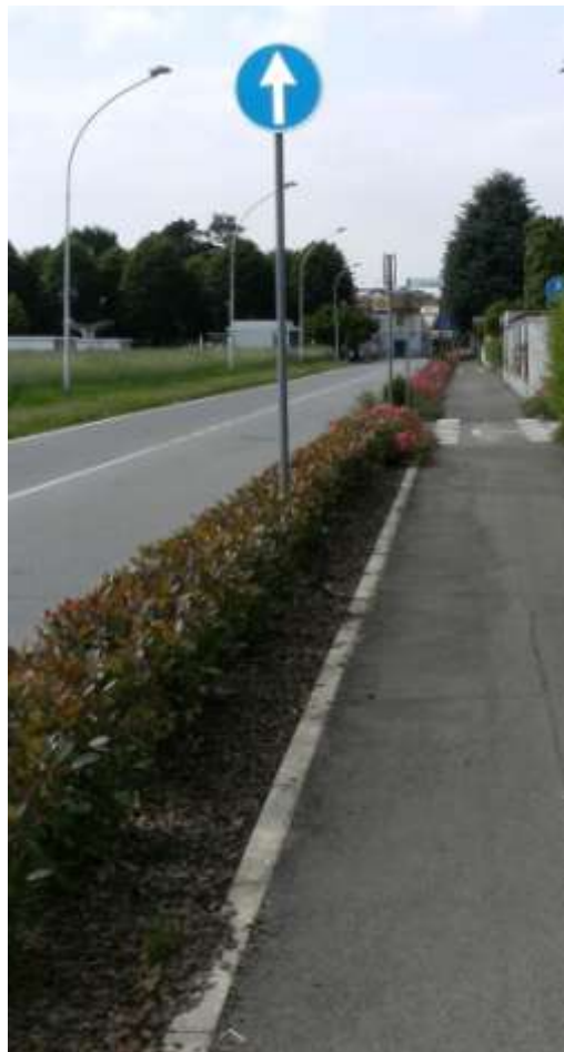
Realizzazione di piste ciclabili