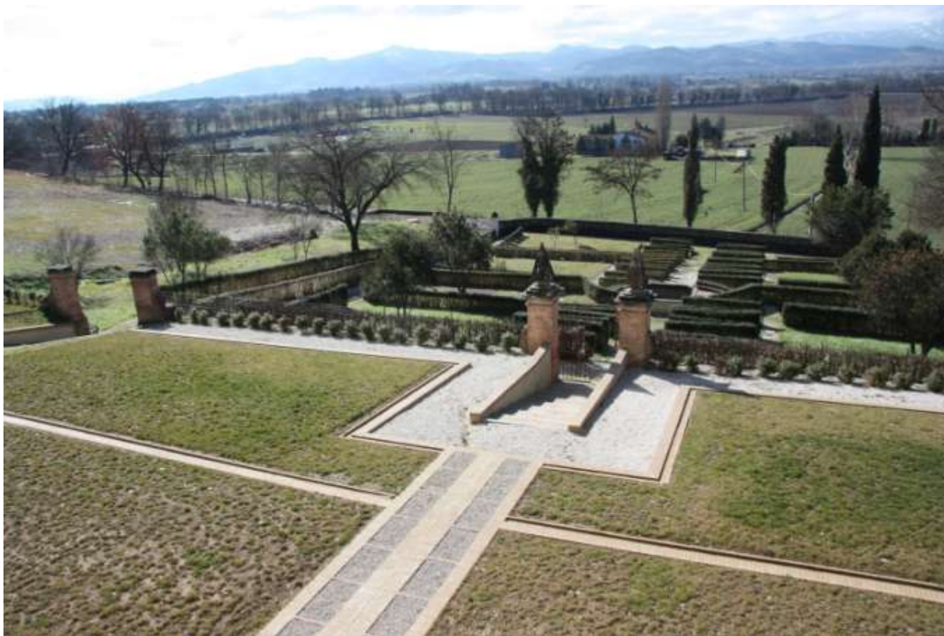
Riqualificazione del giardino storico di Villa Graziani