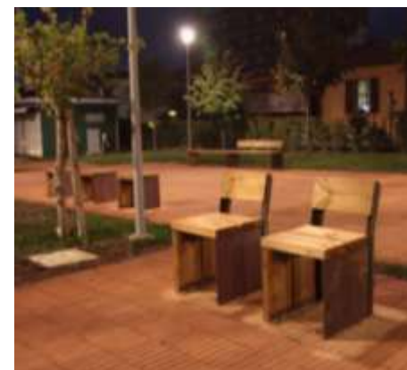
Riqualificazione del Parco della Rimembranza