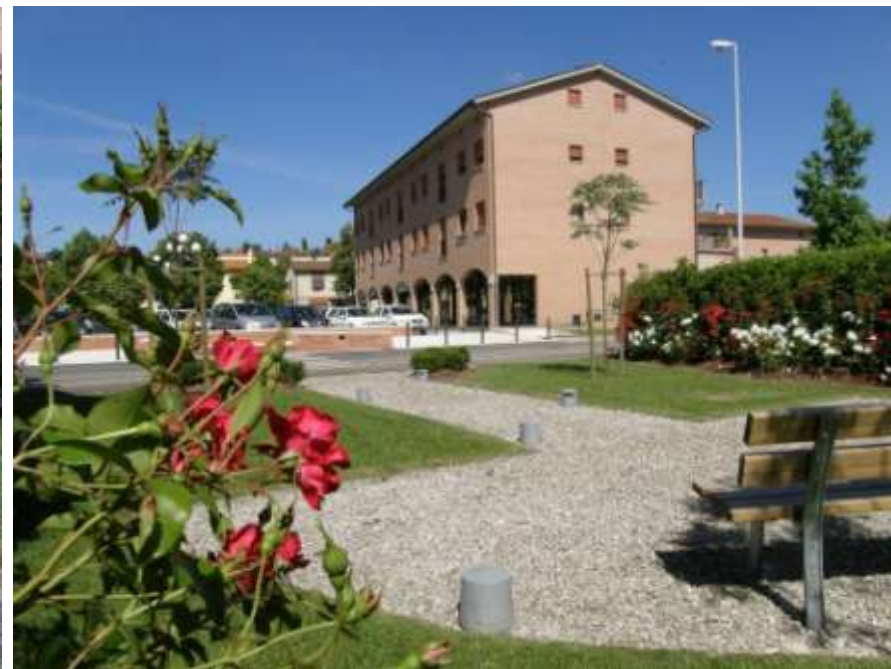
L'area verde retrostante piazza Piero della Francesca prima e dopo la riqualificazione