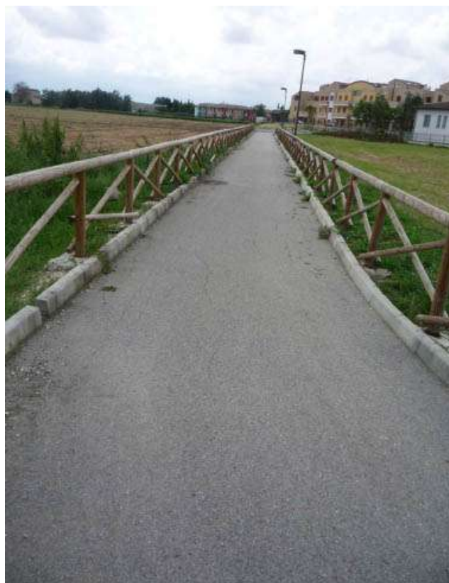
Realizzazione di piste ciclabili