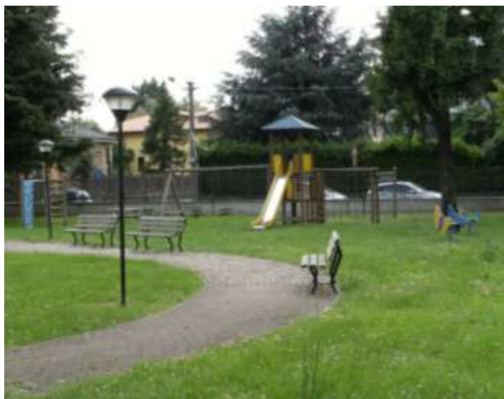
Riqualificazione di un'area verde