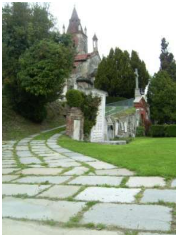
Recupero del vecchio lavatoio