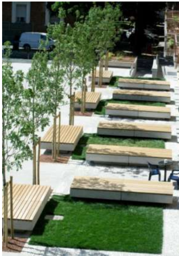
Riqualificazione di piazza Repubblica