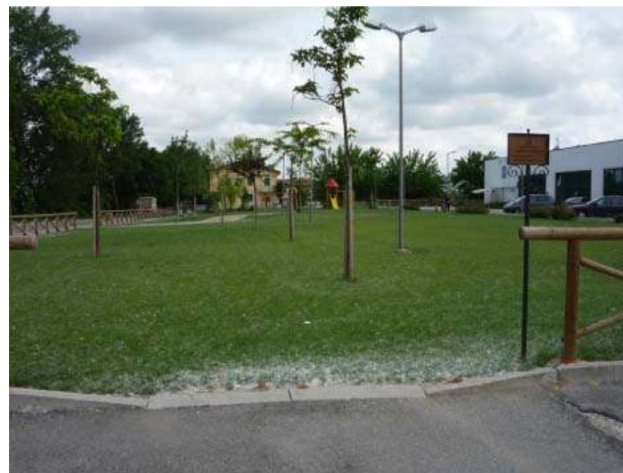
Realizzazione di uno spazio verde con area giochi e collegamento alla pista ciclopedonale