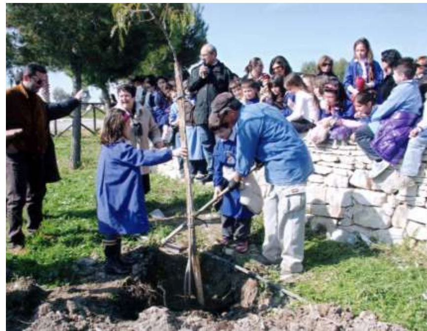
"Festa dell'Albero" di promozione della cultura ambientale