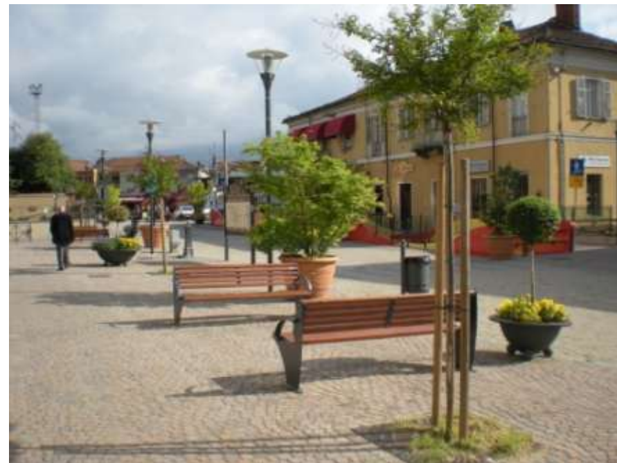
Realizzazione di una piazza