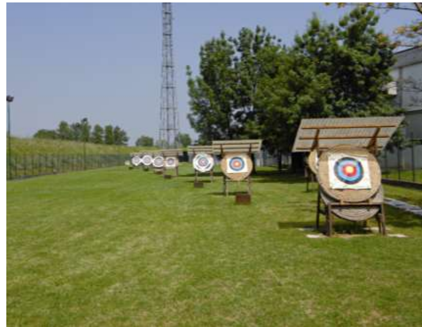
Realizzazione di un centro sportivo