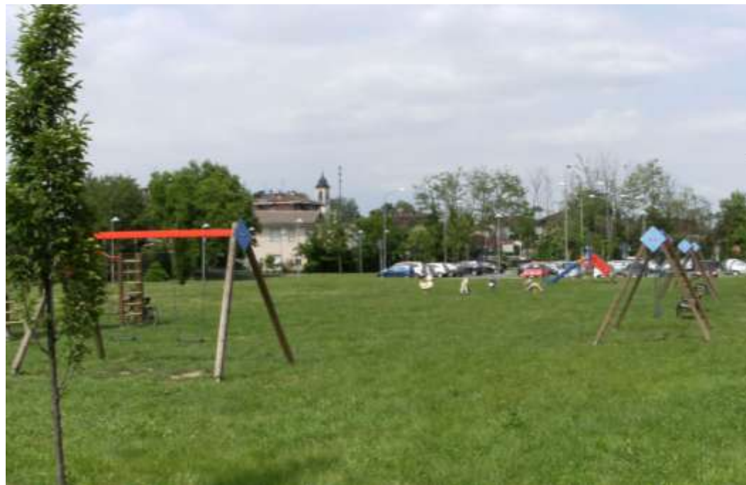
Realizzazione di un parco urbano con area giochi e sosta