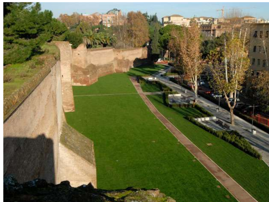
Il Parco lineare delle Mura prima e dopo la riqualificazione