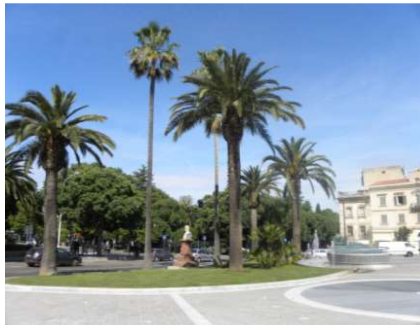
Inverdimento delle aree di parcheggi interrati