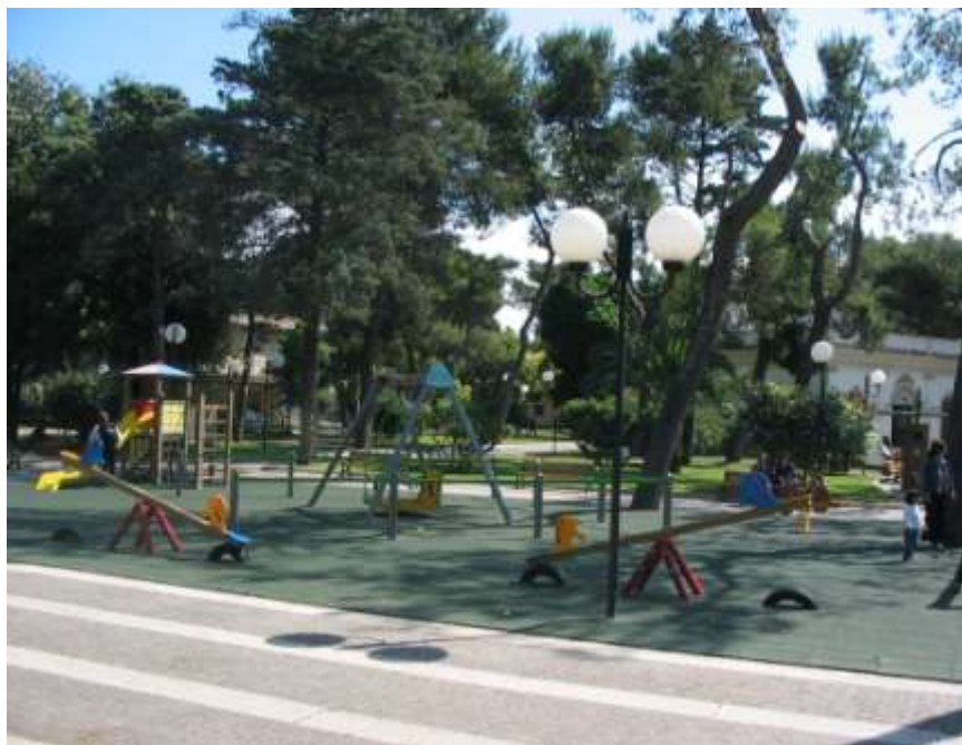
Riqualificazione di un'area gioco bambini