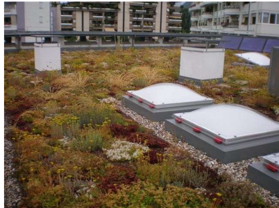
Copertura a verde pensile sul tetto della scuola materna Postano