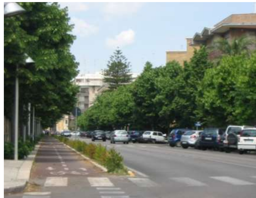
Realizzazione di nuove piste ciclabili