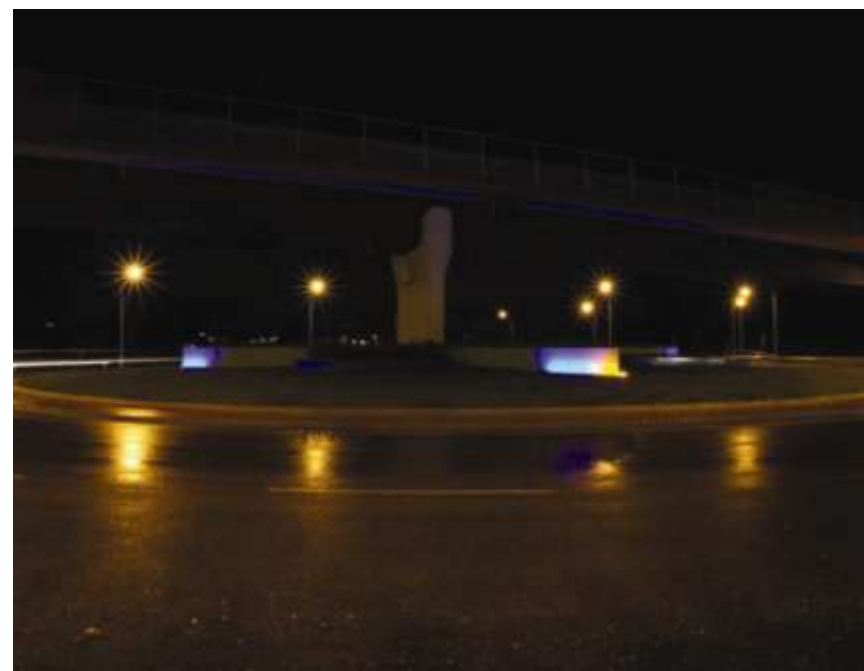
Arredo di una rotatoria stradale