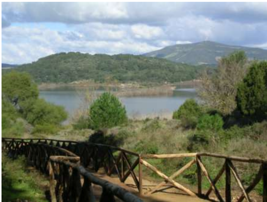
Recupero dell'area naturalistica Lago di Baratz Porto Ferro