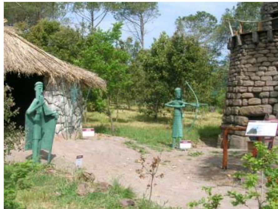
Recupero e valorizzazione dell'area boschiva di Bunnari