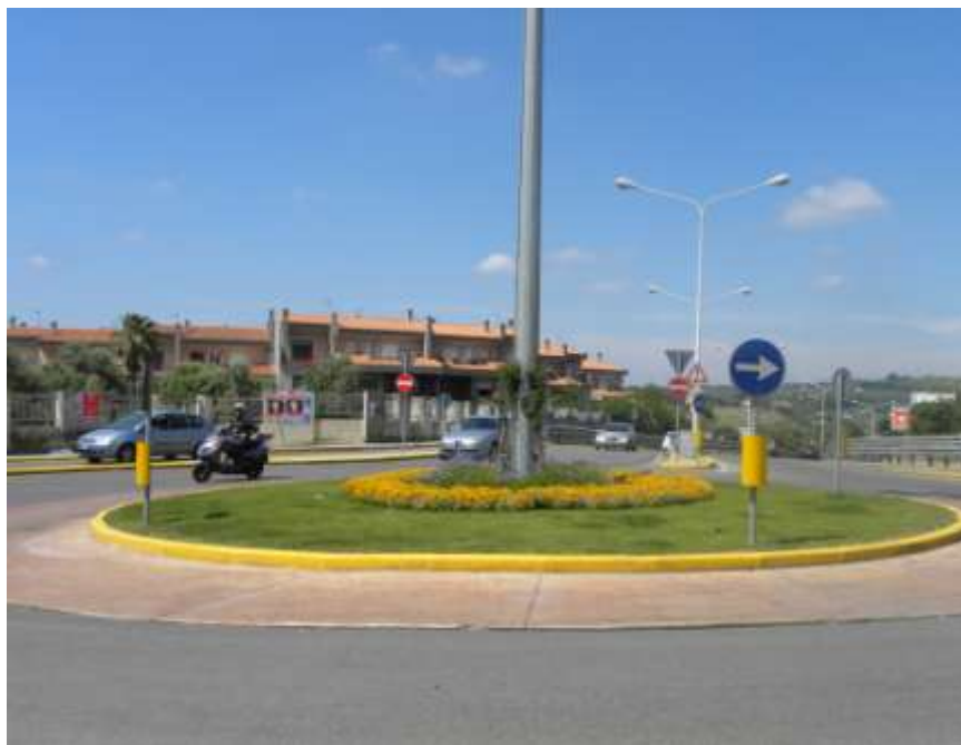
Allestimento a verde di rotonde stradali