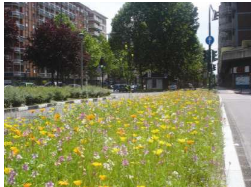
Aiuole fiorite con i wildflowers