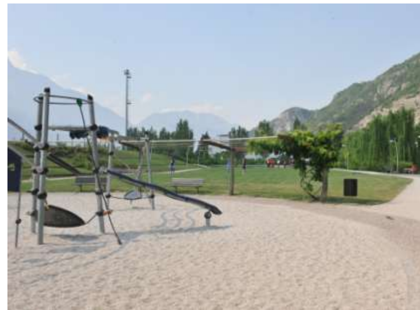
Riguardo alla rigualificazione dei giardini della scuola media Argentario