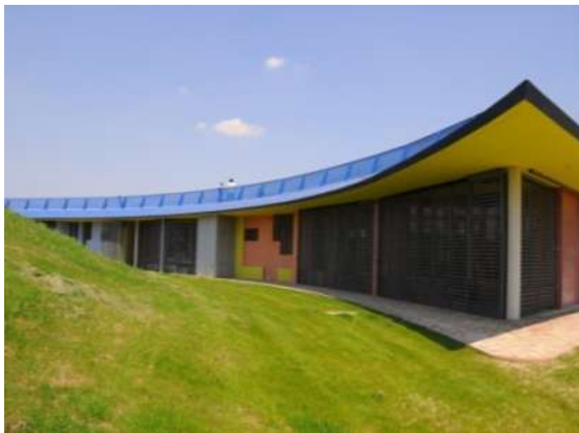
Realizzazione della copertura a verde pensile sulla casa del Parco Colonnetti