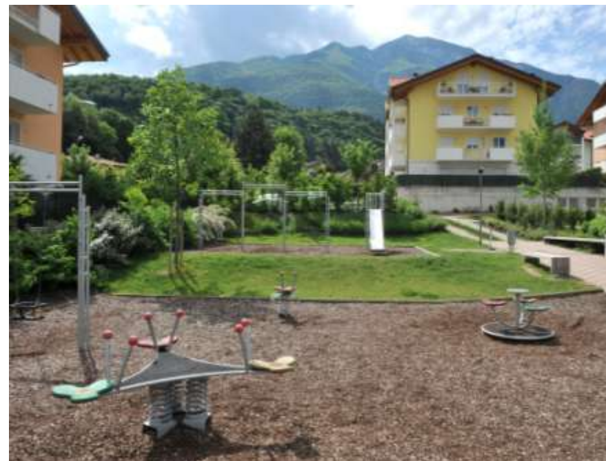
Realizzazione del parco di via della Rozola a Mattarello