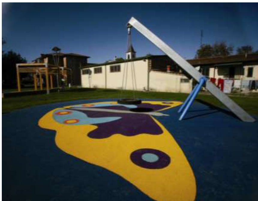
Realizzazione di una nuova area gioco