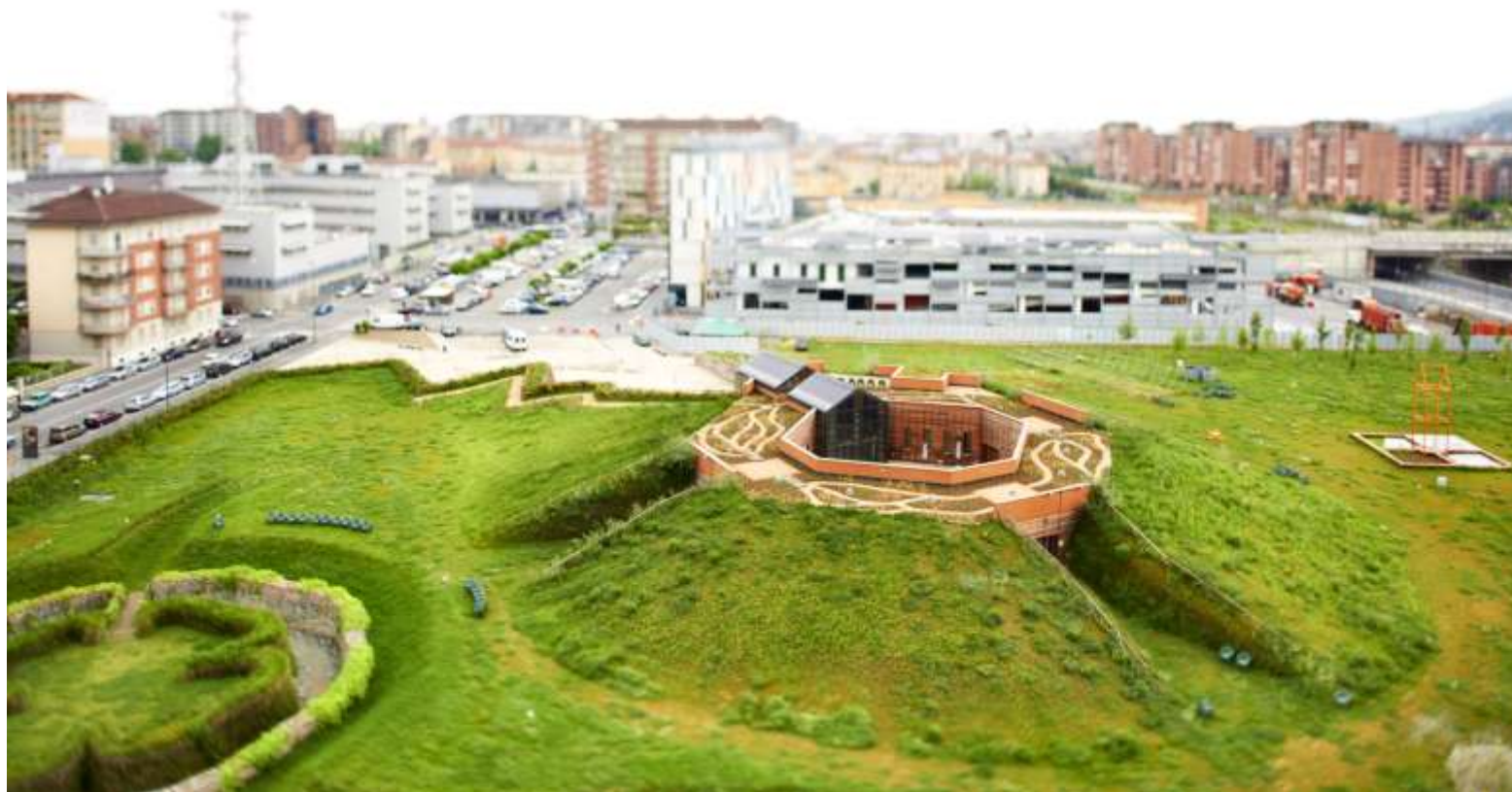
Realizzazione del parco di arte vivente (PAV)