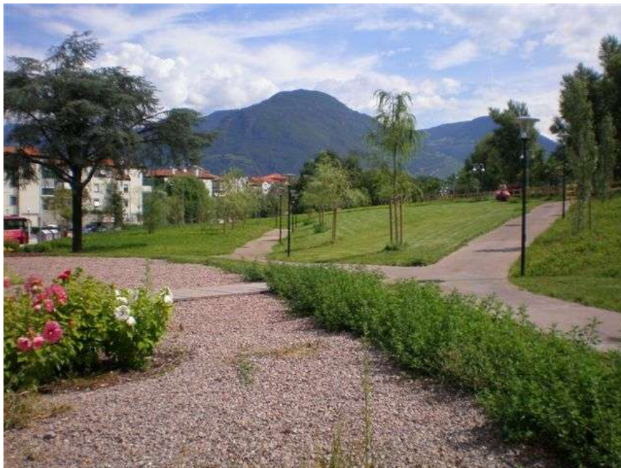
Realizzazione del nuovo parco di via Genova