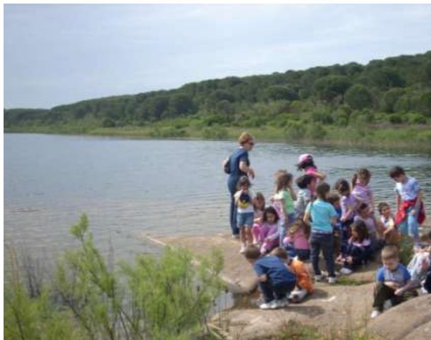
Iniziative di educazione ambientale