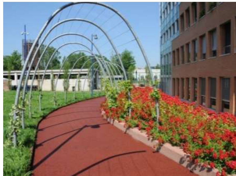
Riqualificazione del giardino di Villaglori