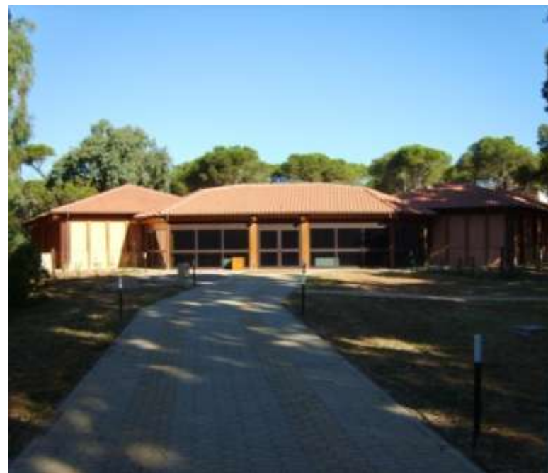
Riqualificazione della Pineta di Platamona