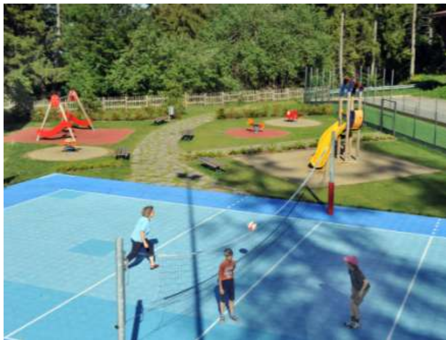
Realizzazione della nuova area sportiva nell'abitato di Vaneze sul monte Bodone