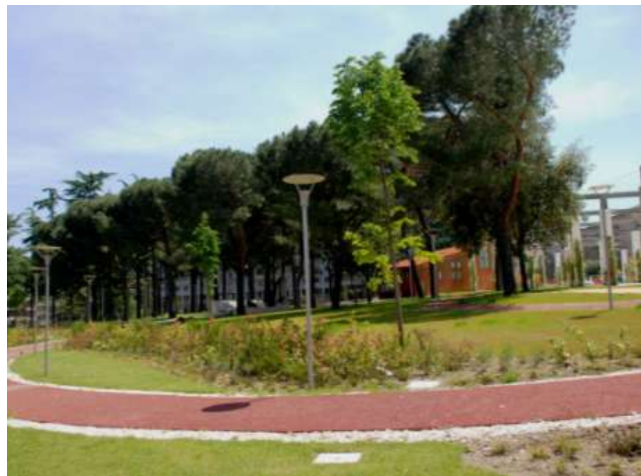
Riqualificazione del parco urbano "Piazza Kennedy"