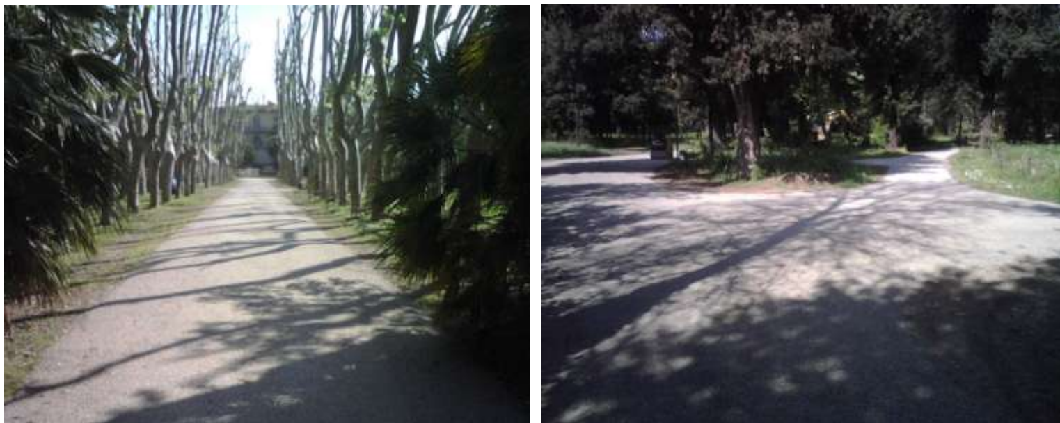
Riqualificazione del parco di Villa Fabbricotti