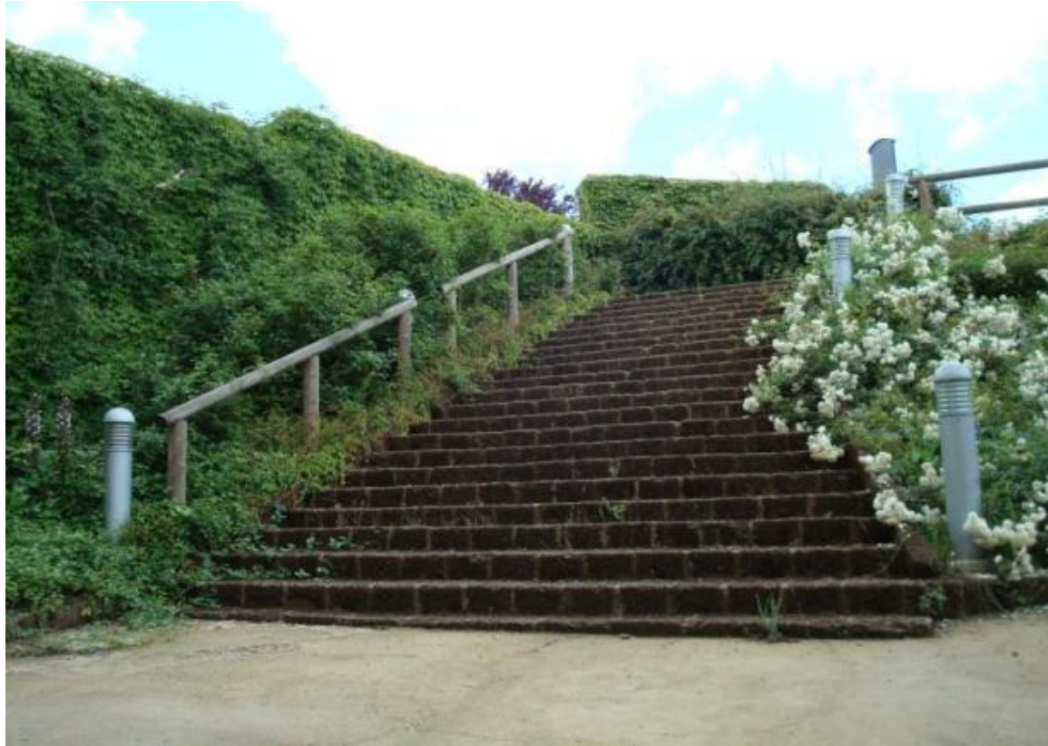
Giardino urbano del Ritello