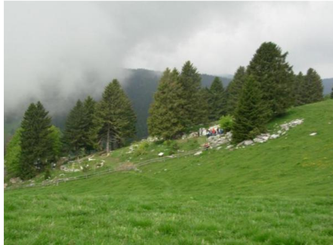
Giardino botanico alpino del Monte Corno

Progettisti: Antonio Cantele, Maurizio Novello